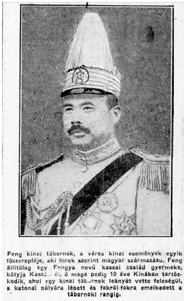
3. kép. Feng Yuxiang fényképével illusztrált hír a Pesti Hirlap 1927. február 27-i számában