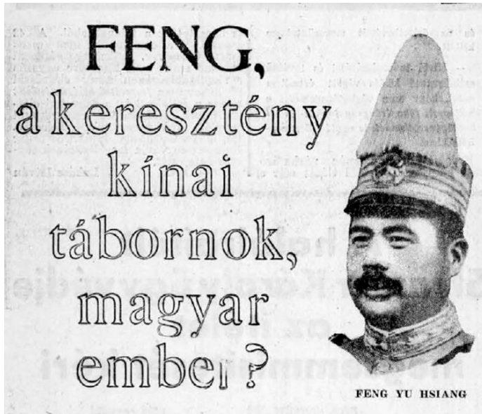
5. kép. A hír címe Az Estben 1936. december 30-án

Másnap, 1936 szilveszterén az Uj Nemzedék „Gyászzelentés a Feng-legendáról” címen egy félhasábos hírben cáfolja az állítást, és emlékezteti az olvasót arra, hogy ez nem más, mint egy régi hírlapi kacsa: