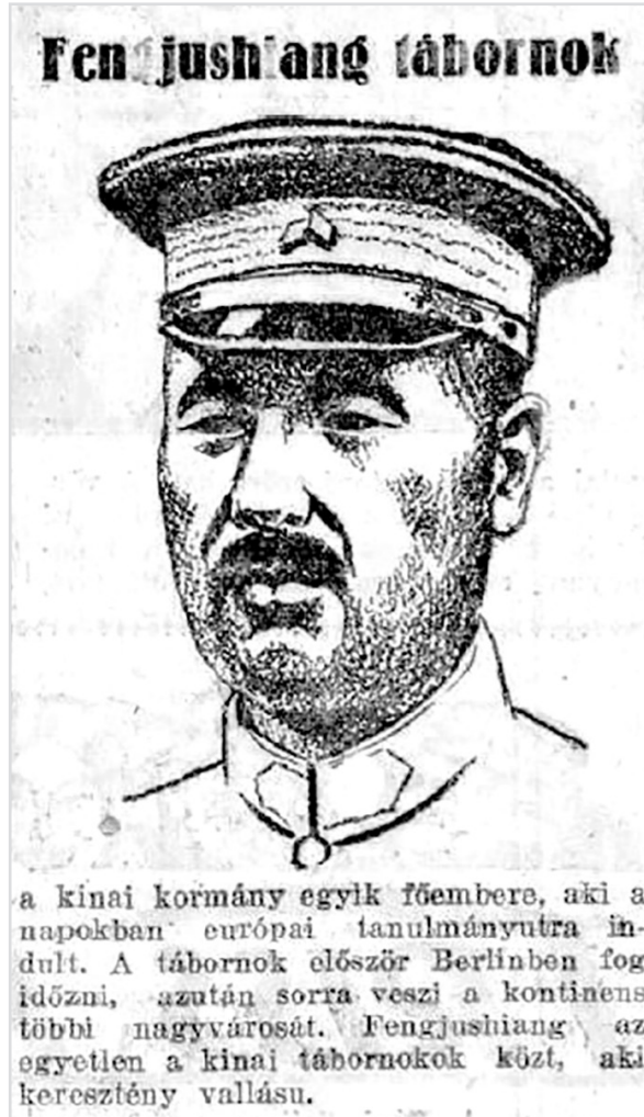
2. kép. Az 1926 januárjában vereséget szenvedett Feng Yuxiang európai „tanulmányútról” tudósító hír

nok által támogatott Zhang Zuolin csapataival kénytelen volt visszavonulni Mandzsúriába.