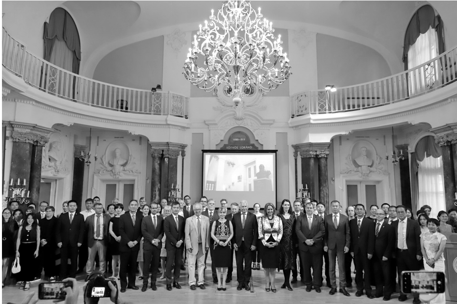
15 éves jubileumi gála az Aula Magnában 2022. június 21-én.

egyéni teljesítmény elismerésének örülhet. Létrehozta az egyetlen, kínaiak által elismert hivatalos regionális tanárképző központot, és megalapította a Középkelet-európai Kínai Tanárok Szövetségét. Az Intézet a Konfuciusz Könyvtár sorozatban 7 tudományos monográfiát, 2007 óta 18 Konfuciusz Krónikát jelentetett meg, továbbá támogatta a Távol-keleti Tanulmányok című folyóirat megjelenését, amelyből 2010 óta 21 szám látott napvilágot.