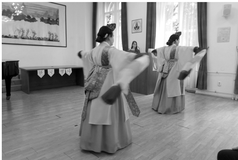
A Mugunghwa táncgyűttes előadása.

Az I. koreai fesztivál ötlete a tanszék oktatóiban fogalmazódott meg a COVID-időszak utáni élő oktatás újraindításának az öröme. Céljuk az volt, hogy összehozzák a koreai szak különböző évfolyamaira járó hallgatóit, különös tekintettel az egyetemet a karantén időszaka alatt elkezdő fiatalokra, hogy interaktív, színes programok keretében személyesebb formában ismertessék meg velük a koreai kultúra különböző területeit.