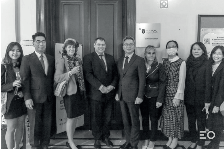
Az ELTE Sejong Intézet megnyitója, 2021. szeptember 21.