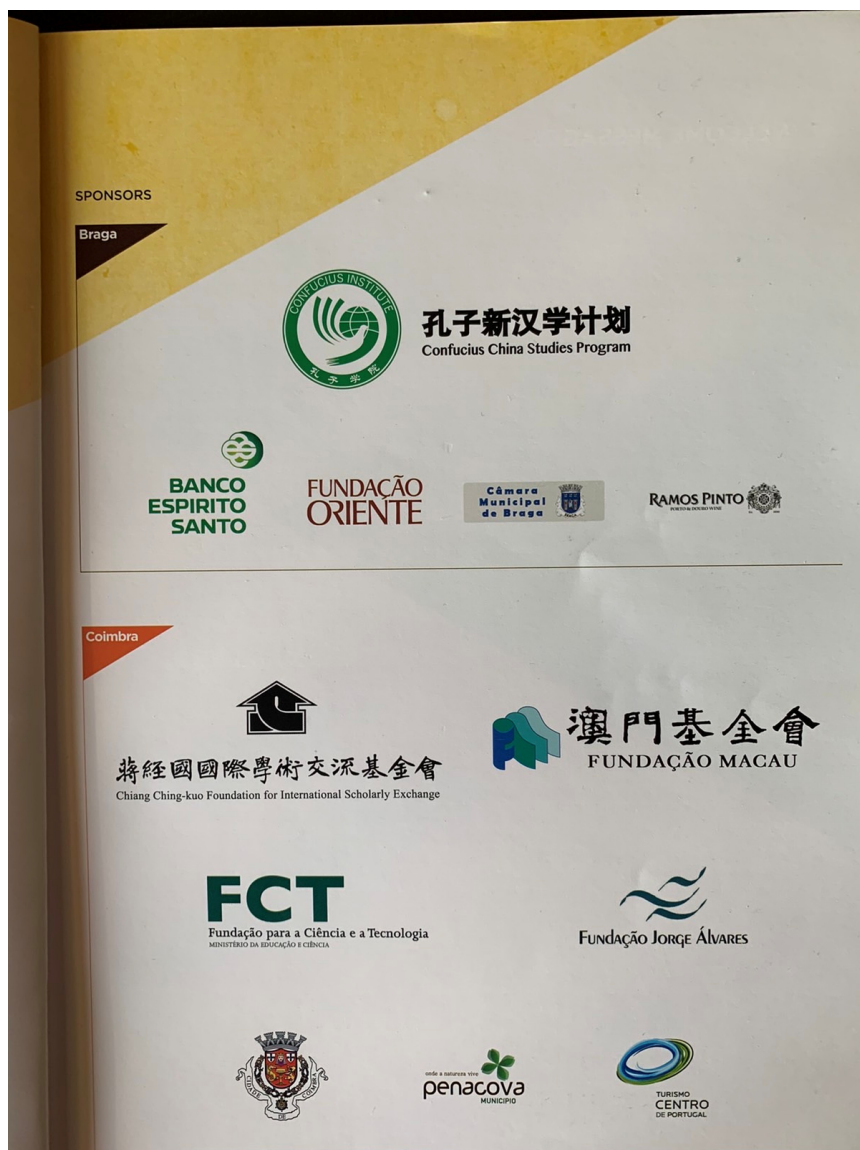
2. kép. A 2014-es bragai EACS konferencia brosúrájának a szponzorokat tartalmazó oldala