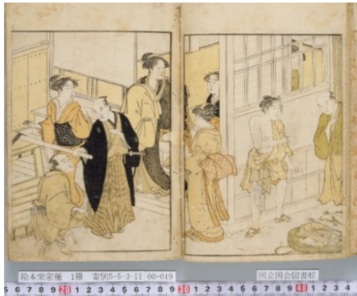
2. kép Ehon sakae gusa 2. kötet 7. oldal.