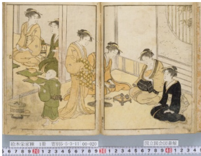
3. kép Ehon sakae gusa 2. kötet 8. oldal.