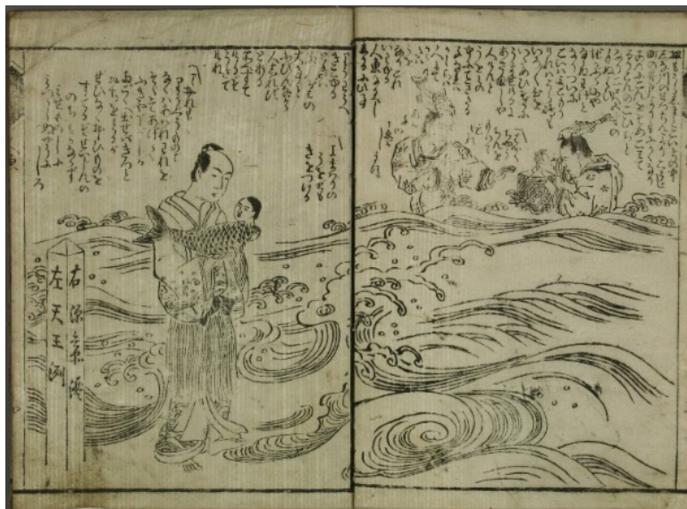
6. kép Hakoiri musume menyáningyō

(Halemberek:) „Hozz gyorsan egy lámpást, kisbaba sírását hallom!” (Urashima Tarō:) „Ajhaj, te szegény! Ha nem a sárkánykastély népe közül való volnál, legszívesebben én nevelnék fel. Ha Ryōgokuban bemutatlak volna, biztosan nagy visszhangra leltünk volna. Jajj de kár....”