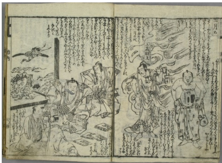
4. kép Sakusha tainai totsuki no zu

„A yin-yang egy cseppjének vizéből fogan a gyermek. A festéktartó vizének egy cseppjéből fogan a történet magja. Aztán ha apa nélküli gyermek fogan, az az írónak nem probléma. Ám ha valaki lányának gyermekéről van szó, abból aztán nagy botrány lesz.” (3ウ, 4. kép jobb oldala)