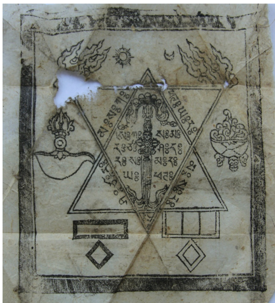
3. kép Tibeti írásos védelmező amulett

A buddhizmus elterjedésével a korábbi amulettek szerepét különböző buddhista istenségek szobrai, 10 képi ábrázolásai és különböző szimbólumok (pecsétek) vették át. 11