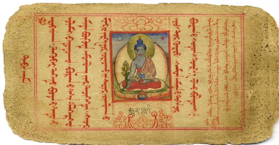
8. kép A Vadzsravágó-szútra utolsó oldala – középen a Gyógyító Buddhát ábrázoló kép látható, a lap jobb szélén a kolofon található