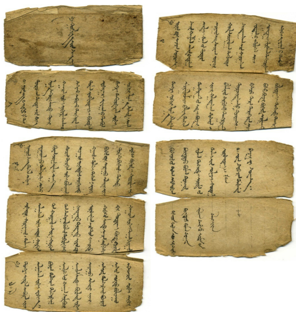
6. kép Mongol füstáldozati szöveg az öt személyes védőistenhez.

A most bemutatandó kézirat a maga nemében unikális, mert a közgyűjteményekben nagyon ritkának számítanak a személyes védelmezőkkel kapcsolatos mongol szövegek. A jelen kézirat egy 12,5×65 cm-es, vékony, olcsó kínai papírlapból áll. Ezt harmonikaszerűen hajtották össze, kilenc 12,5×7 cm-es oldalt alkotva. A papír a hajtások mentén több helyen is szétszakadt (6. kép). A szöveget csak a lap egyik oldalára írták fekete tintával. A címlap és az első lap hátulját összeragasztották, és közéjük egy francia kockás iskolai füzetlapot tettek erősítés végett. Ezen a lapon elmosódott mongol írás található. Az íráskép szép, gyakorlott kézre vall, a „fogak” néhol csak alig vannak, vagy egyáltalán nincsenek jelezve. A sorok szabályosak, egyenletesek, néhol látszik a halvány elővonalazás. Minden második oldalt úgy számozták meg, ahogy a póthi alakú könyvek esetében. Az utolsó lapon szemmel láthatóan más kéztől és más tintától származó, kevésbé szabályos írás található.