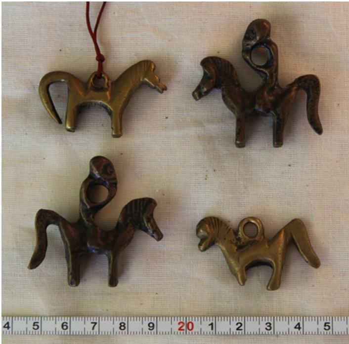
2. kép Amulettként viselhető, rézből készült mongol ló- és lovas szobrok

részeket (pl. sündisznótüske) is, melyekben a mai napig oltalmazó erőt sejtnek a mongolok. 6 Az ongon oknak, melyekben elhalt sámánok erejét vélték, szintén védelmező erőt tulajdonítottak. 7 Egy amulett-típus azonban túlélte a buddhizmus terjedését: az apró bronzlovak, néha lovassal (2. kép).