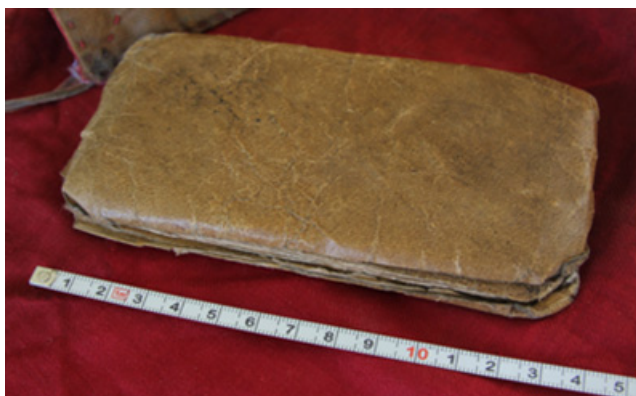
1. kép 1 Mongol kéziratcsomag

Jelen tanulmányban egy Mongóliából származó, feltehetően személyes használatra összeállított, néhány kéziratból álló, apró csomagot kívánok bemutatni. A kemény bőrbe burkolt, vászonba kötött csomag elfér egy kisebb zsebben is, méretei: 14×7×1,5 cm (1. kép).