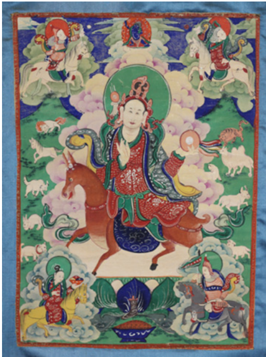
5. kép Az öt személyes védelmező istenség a Tuvai Nemzeti Múzeum gyűjteményéből

A személyes védelmezőistenek mongol neve γobilh-a , ami a tibeti alak ( go ba'i lha ) átvétele. A kultusz eredete a prebuddhista tibeti időszakra vezethető vissza. 12 A személyes védelmezők születéstől kezdve kísérik és oltalmazzák az embert. Öten vannak, tibeti nevük: Mo lha , Srog gi lha , Pho Lha , Yul lha , dGra lha . 13 Kultuszuk Tibetből a buddhizmus nyomán került mongol területekre, azonban mongol nyelvű szövegekben nagyon ritkán fordulnak elő. Mongol és a Mongóliával határos tuvai területekről elsősorban képi ábrázolásai ismertek (5. kép). 14 Feltehetően tibeti nyelvű áldozati szövegeket is találhatunk különböző mongol gyűjteményekben, de ennek feltárása tibetista kutatókra vár.