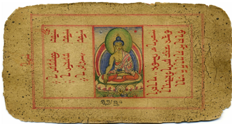
7. kép Vadzsravágó-szútra első oldala, középen a Sákják bölcsét, Buddhát ábrázoló kép