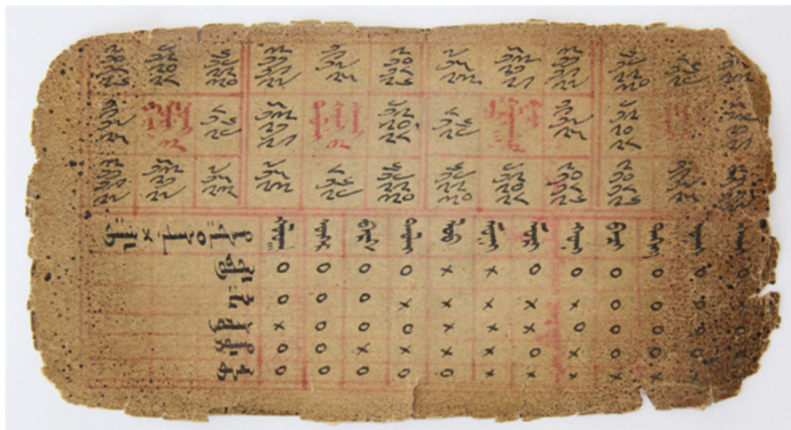
9. kép Asztrológiai táblázat