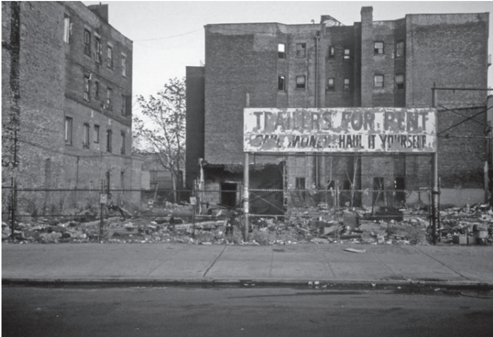
2. ábra: Lower East Side, 1980

street art is. Turisztikai látványosság számba mennek az ilyen munkák, a vimbly.com weboldalon például fejenként harminc Dollárért részt lehet venni egy két óra időtartamú idegenvezetésen, melynek kifejezett célja a különböző street artok bemutatása. A Lower East Side szubkulturális forradalmának végül a dzsentifikáció vetett véget.