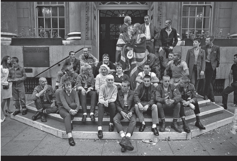
1. ábra: Skinhead esküvő, Nyugat- London, 1981. Figure 1. Skinhead Wedding, West London, 1981