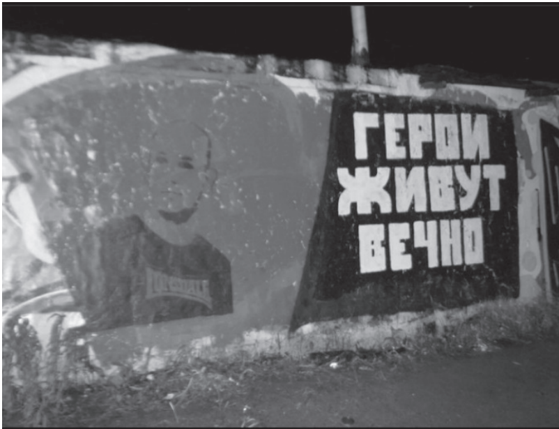
4. ábra: A nem hivatalos Ivan Khutorskoy-emlékfal, Moszkva, 2009 Figure 4. The unofficial Ivan Khutorskov memorial wall, Moscow, 2009.

fejezetekben. Az olyan szubkultúrák, mint például a punk, vagy a skinhead eredendően a munkásosztályban jelentek meg először és politikailag baloldaliként jellemezhetőek. Térhasználatuk jellegzetes, megjelenésükkel feltűnést keltenek, ezáltal kerültek be széleskörben a köztudatba. Több Instagram oldal is foglalkozik az említett vagy az azokhoz hasonló szubkultúrák utcai jelenlétével, művészetével és jelzéseivel.