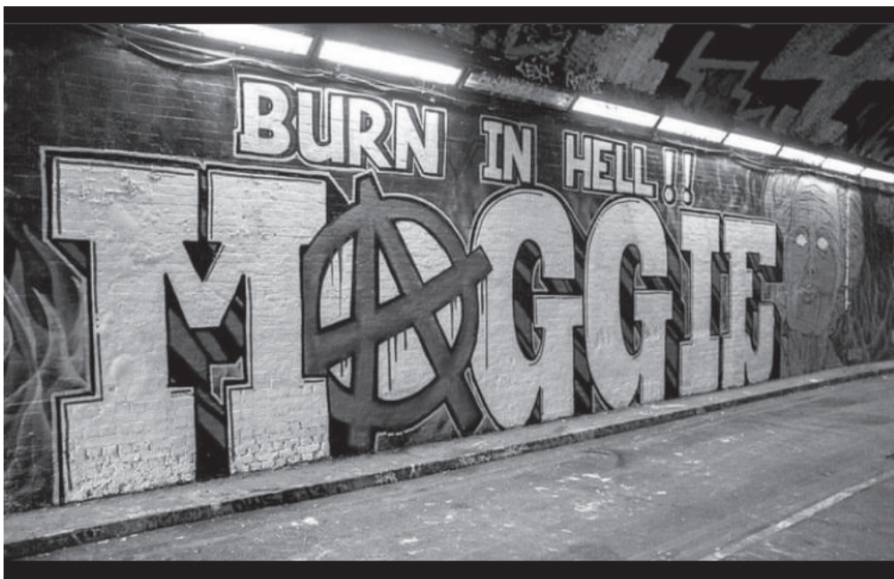
3. ábra: Politikai állásfoglalás a falakon Figure 5. Political statement ont he walls

fényképe Oroszországban készült, Moszkvában. A festményen szereplő férfi Ivan Khutorskoy, antifaszista skinhead, akit 2009. 11. 16-án támadtak meg és végeztek ki egy neonáci csoport tagjai ( THE LIFE AND DEATH OF IVAN KHUTORSKOY, RUSSIAN ANTIFASCIST MURDERED IN NOVEMBER 2009 ). A moszkvai underground egyik híres arcaént a történet megrázták az egész közösséget, a mellékelt fénykép is akkortájt készülhetett, pontos dátum nem áll rendelkezésre. Az oroszországi underground talán mind közül a legveszélyesebb színtér nyílt politikai állásfoglalásra, ugyanis nem Ivan Khutorskoy volt az első áldozat, a szubkulturális konfliktusok gyakran torkollanak erőszakba, nem egyedi a haláleset sem. Itt megemlíteném Marija Aljohina, A lázadás napjai című könyvét, melyben a Pussy Riot ellen indult kulturális hadjárat kerül bemutatásra. Mindez jól érzékelteti az oroszországi helyzetet ( ALJOHINA 2020 ). Bizonyos csoportok, például a punk szubkultúra követői, jellemezhetőek ellenkultúráként is a többségi társadalom normarendszeréről alkotott véleményük, ahhoz történő viszonyulásuk alapján ( TAYLOR 1994 ). Térhasználatuk jellegzetessége a kutatás leíró részében is előkerült már, megállapítható, hogy más szubkultúrákhoz hasonlóan a liminális tér jelent számukra valódi lehetőséget ( GORNOSTAEVA, CAMPBELL 2012 ). Szembehelyezkedésük a normarendszerrel, jellegzetes térhasználatuk egyértelműen kifejezi viszonyukat a karhatalmi erővel ( 5. ábra ).