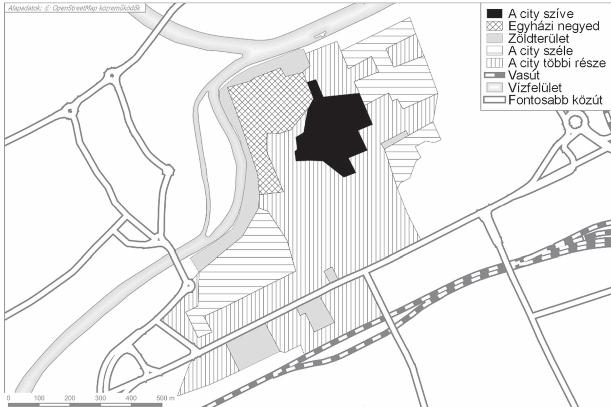
6. ábra: A city funkcionális tagolódása Győrben Figure 6. Functional division of the city in Győr

szemünk előtt vált funkciót, a lakófunkció fokozatos kiszorulása, új, nonprofit intézmények/épületek, illetve elsősorban profitorientált gazdasági és üzleti szerepkörök megjelenése következtében.