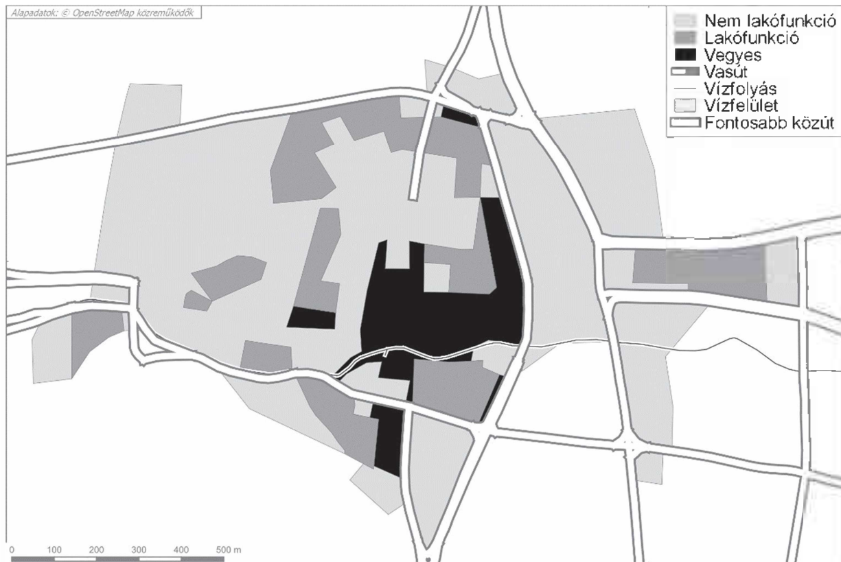
1. ábra: Lakó-, nem lakó- és vegyes funkciójú területek a miskolci cityben Figure 1. Residential, non-residential and mixed-use areas in the city of Miskolc