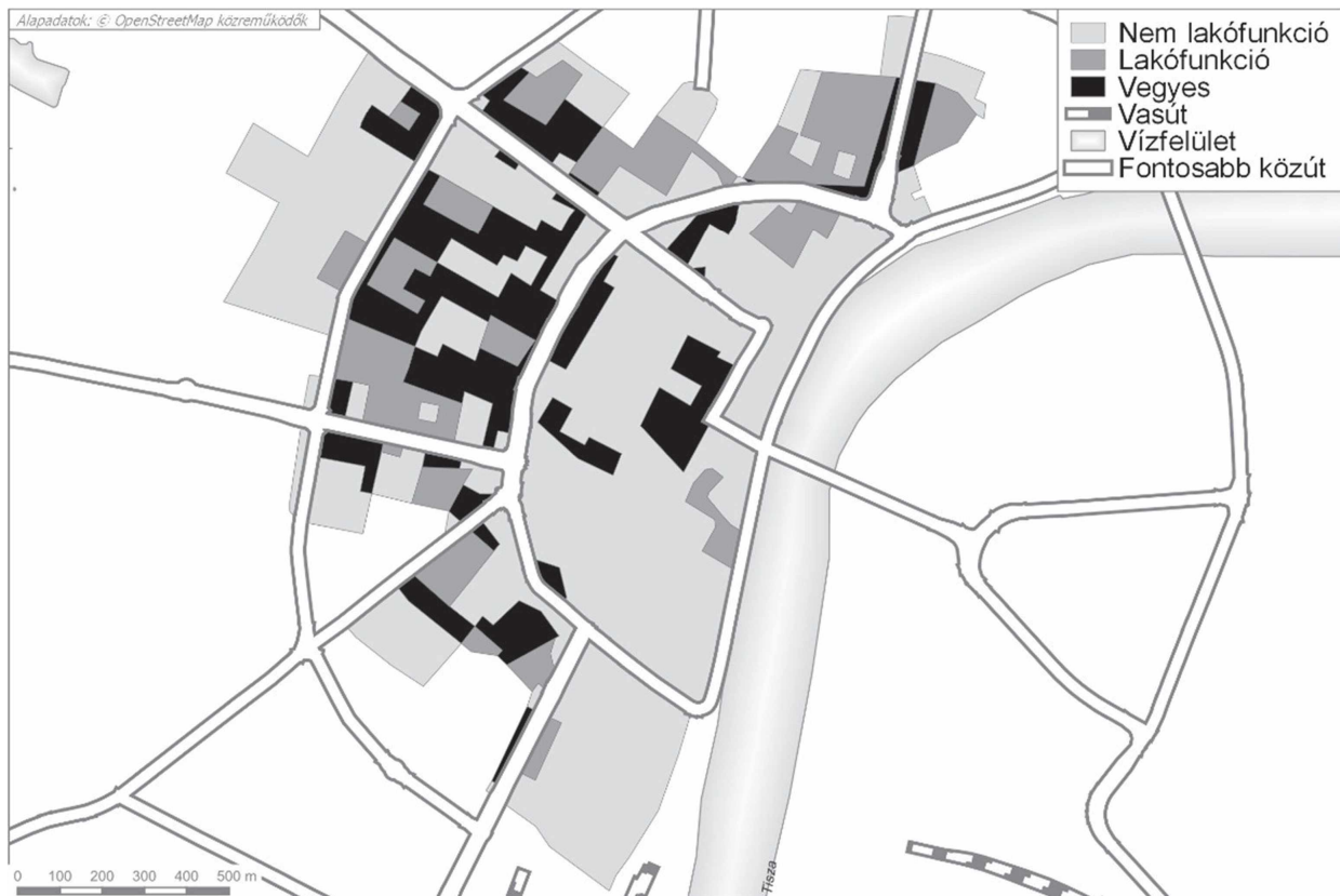
2. ábra: Lakó-, nem lakó- és vegyes funkciójú területek a szegedi cityben Figure 2. Residential, non-residential and mixed-use areas in the city of Szeged