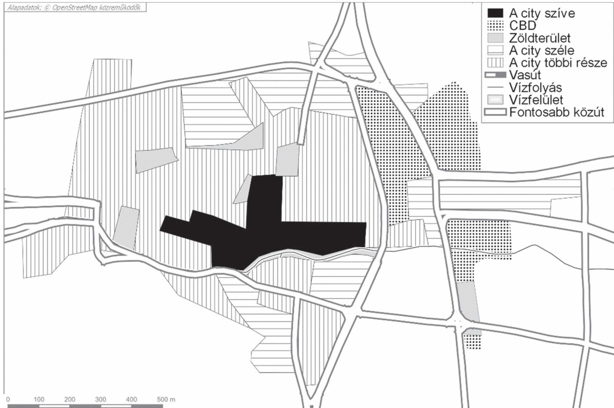
5. ábra: A city funkcionális tagolódása Miskolcon Figure 5. Functional division of the city in Miskolc

történelmi városmag mellett, de benne keverednek a lakóépületek is helyet kaptak.