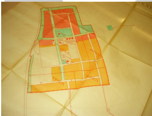
2. ábra: Szikáncs és Batida átnézeti vázlatja 1950-ben Figure 2 Draft plans of Szikáncs and Batida in 1950