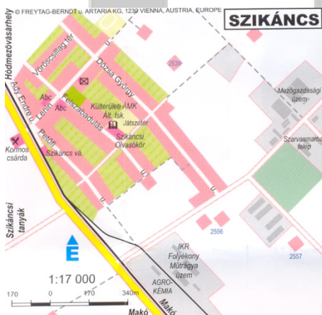
3. ábra: Szikáncs és Batida térképe napjainkban Figure 3 Maps of Szikáncs and Batida nowadays