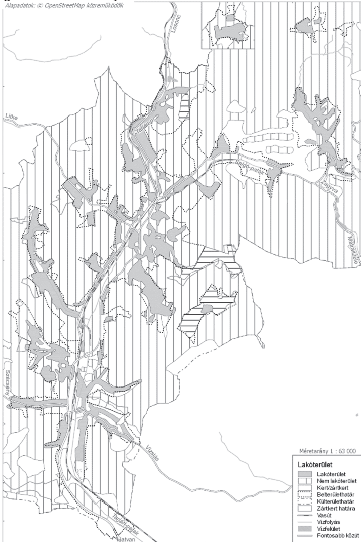
3. ábra: Lakó- és nem lakóterületek elhelyezkedése Figure 3. Location of residential and non-residential areas