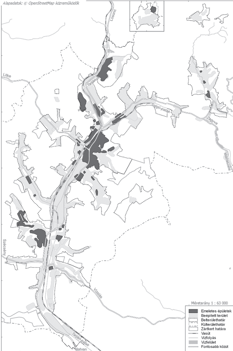
1. ábra: Emeletes épületek elhelyezkedése Salgótarjánban Figure 1. Areas built up with multi-storey buildings in Salgótarján