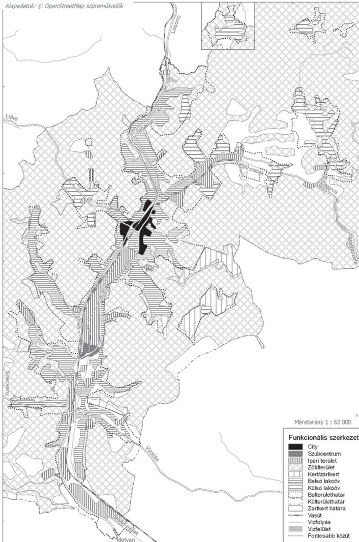
4. ábra: Salgótarján funkcionális szerkezete Figure 4. The functional structure of Salgótarján