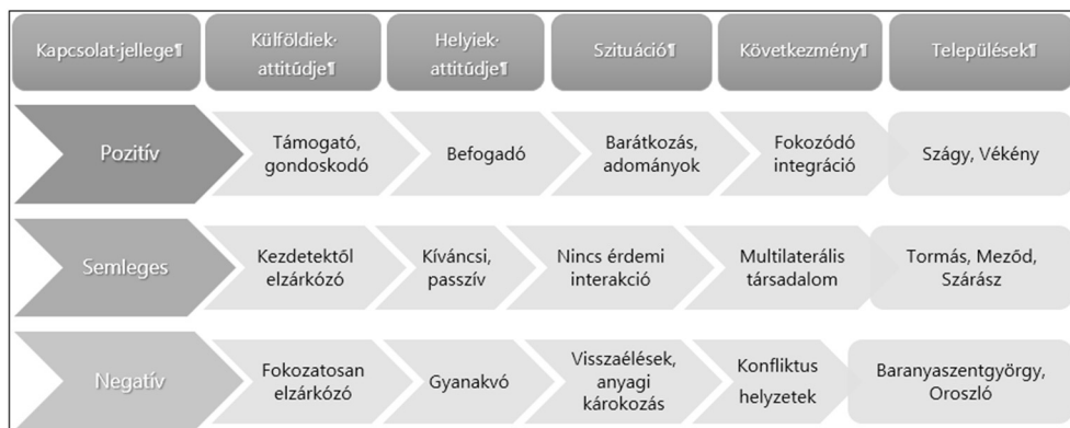
7. ábra: A vizsgált települések csoportosítása a integrációs mintázatok alapján Figure 3. Groups of different integration patterns in the evaluated settlements

A legtöbb településen mind a polgármesterek elmondása, mind interjúalanyaink elbeszélései alapján egy semlegesebb viszony alakult ki a külföldiek és a helyiek között. Habár nem mondhatjuk, hogy válaszadóink nem használják a települési teret, gyakran sétálnak a faluban, közülük van, aki napjában kétszer is, ugyanakkor a helyi társadalom hozzáállása kevésbé befogadó, érdeklődő. Sokszor az is problémát jelent, hogy ezeken a településeken a helyi közösségi rendezvények hiánya, a közösségi tevékenységek helyszíneinek megkopása, eltűnése is jellemző, így például sokkal nehezebben jönnek létre azok a találkozási pontok, ahol a két fél közeledhetne egymáshoz. Ugyanakkor azt is kiemelnénk, hogy az így jellemezhető falvak esetében negatív kommunikációra vagy rossz tapasztalatokra sincs igazán példa, csupán a helyi lakosság és a külföldi beköltözők minimális interakciókra szorítkozó egymás mellett éléséről. Ezek a települések emiatt (is) multilaterális társadalommal jellemezhetők, ahol a jellemzően szegényebb helyi lakosság és a beköltözők közti státuszbeli különbségek szemmel láthatóan is érzékelhetők, ami tovább erősítheti a magyar népesség idegenkedését.