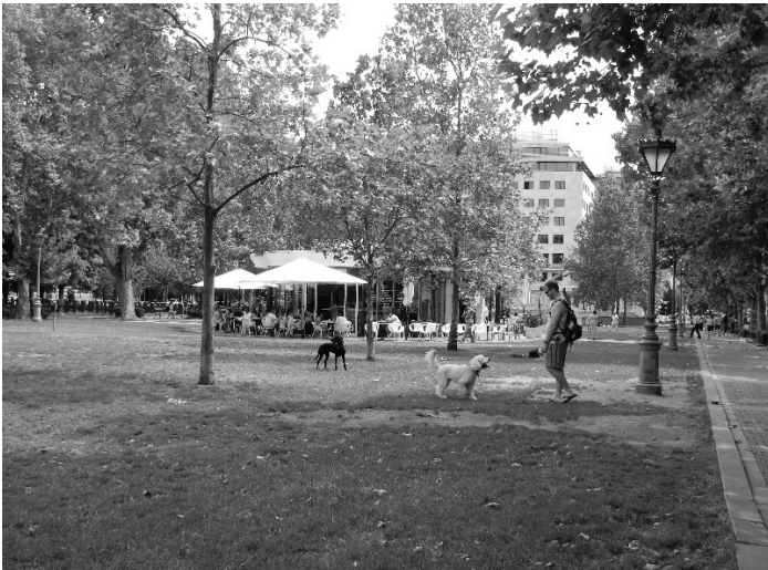
6. kép: A rekreációs funkció megjelenése a Szabadság tér középső részén Photo 6. The recreational function of the middle section of the square