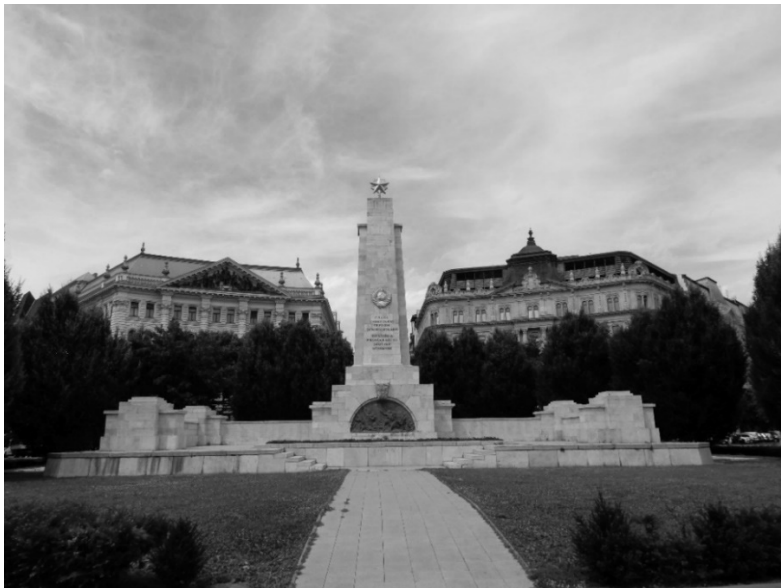
4. kép: A szovjet hősi emlékmű Photo 4. The Soviet Heroic Memorial

A tér északi oldalán a Szovjet hősi emlékmű (4. kép) csak geometriailag ellenpontja a déli résznek; a terepi megfigyeléseim alapján ezt alig látogatja és fényképezi valaki. Valamelyest népszerűbb – különösen a külföldi turisták körében – Ronald Reagan szobra, amellyel viszont többen is fényképezkednek – ezt a szobor elhelyezése is lehetővé teszi, hiszen a járdán, az „emberek között” állították fel (5. kép). A szobor a szovjet emlékművet és a Parlamentet összekötő útvonal mentén áll, így meglehetősen forgalmas helyen található. A Parlament felől érkező, vagy oda tartó turisták itt haladnak el, így szükségszerűen érintik a volt amerikai elnök szobrát. A megfigyelések tapasztalatai alapján vannak, akik kicsit értetlenkedve, nevetgélve fogadják, hogy Budapesten szobra van Reagannek.