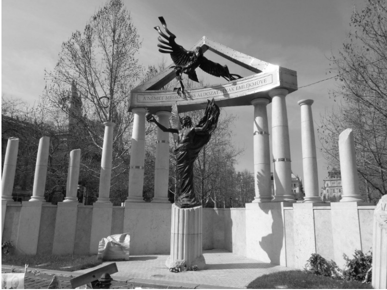
1. kép: A Német megszállás emlékműve a Szabadság téren Photo 1. Memorial to the victims of the German occupation

kritikusok ezt gyakran úgy értelmezik, hogy az emlékmű üzenete az, hogy a megszállók a felelősek a holokausztért [2] – szerintük ezzel Németországra terheli a teljes felelősséget a történekeért.