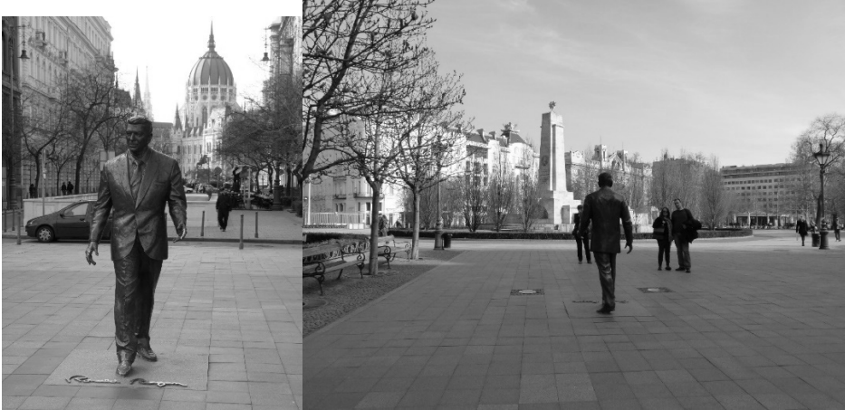
5. kép: Ronald Reagan szobra a Parlament és a Szovjet hősi emlékmű között Photo 5. The statue of Ronald Reagan between the Parliament and the Soviet Heroic Monument