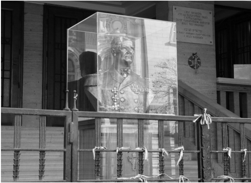
2. kép: Horthy Miklós üvegfalal körbevett mellszobra Photo 2. The statue of Miklós Horthy behind glass walls