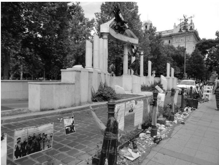
Photo 3. Monument and counter-monument at Liberty square