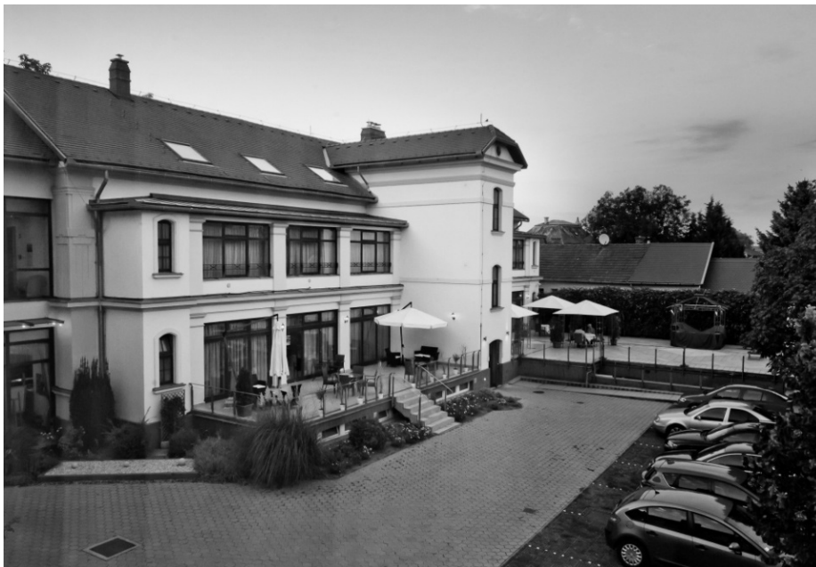
Photo 8. Four star Hotel, near the Fortress – former function: dormitory for a secondary school

8. kép: Négycsillagos hotel a Vár közelében – korábbi funkciója középiskolai kollégium