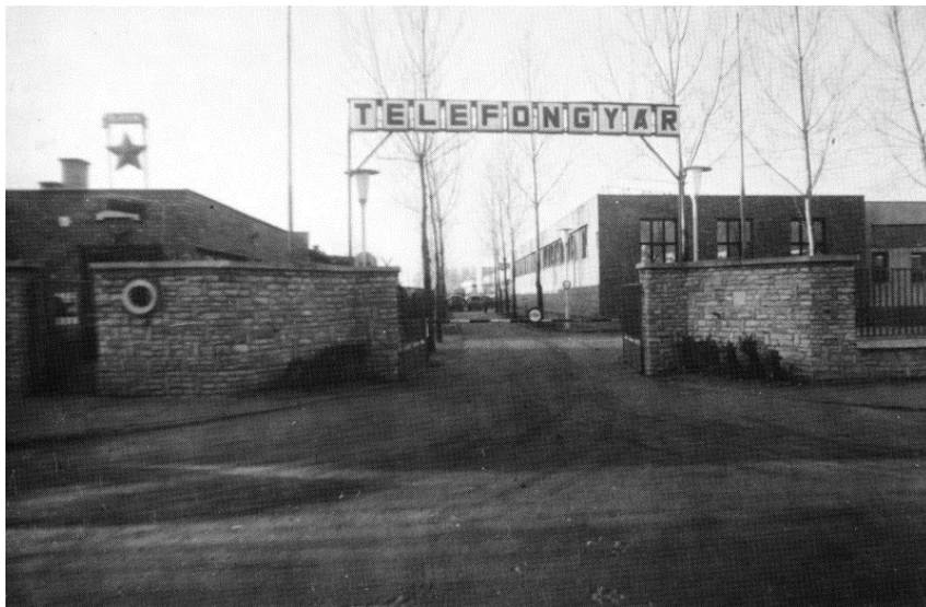
2. kép: A Telefongyár bejárata az 1970-es évek elején. Photo 2. The entrance of wired telephone factory in the early 1970s