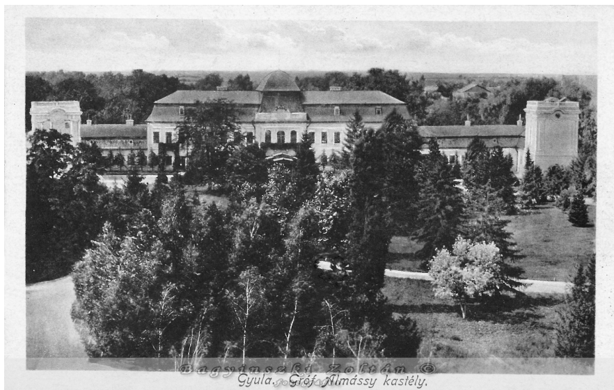
6. kép: A Gróf Almásy-kastély, még mint szociális gyermekotthon (1970-es évek) Photo 6. Almásy Castle used as a child care home in the 1970es