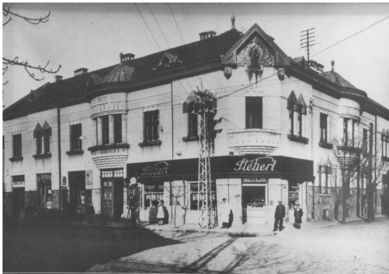
Photo 1. Shop of a local sausage factory in favourable location near the town centre, in 1937