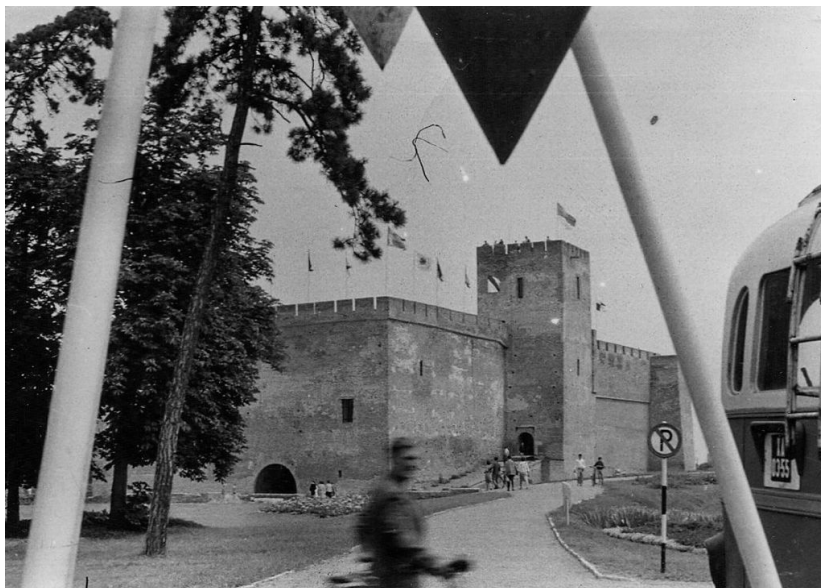
4. kép: A Gyulai Vár tömbje a helyreállítást követően (1964) Photo 4. Gyula Fortress after the renovation (1964)