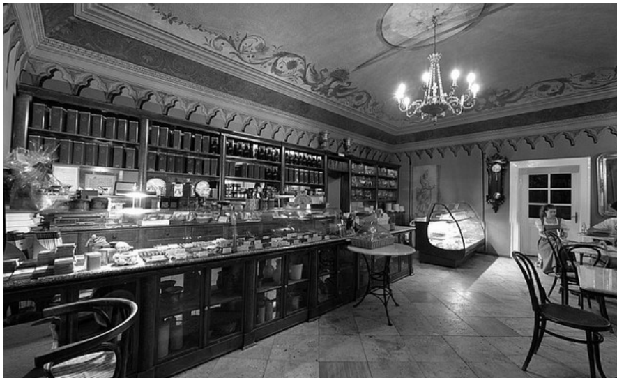
7. kép: A Százéves Cukrászda klasszicista belső tere (alapítva 1843-ban) Photo 7. Classicist interior of a confectionery, founded in 1843