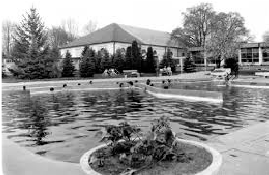
5. kép: A Várfürdő medencéi a szocializmusban (1967) Photo 5. The Bath of Gyula before the mass tourism, in 1967