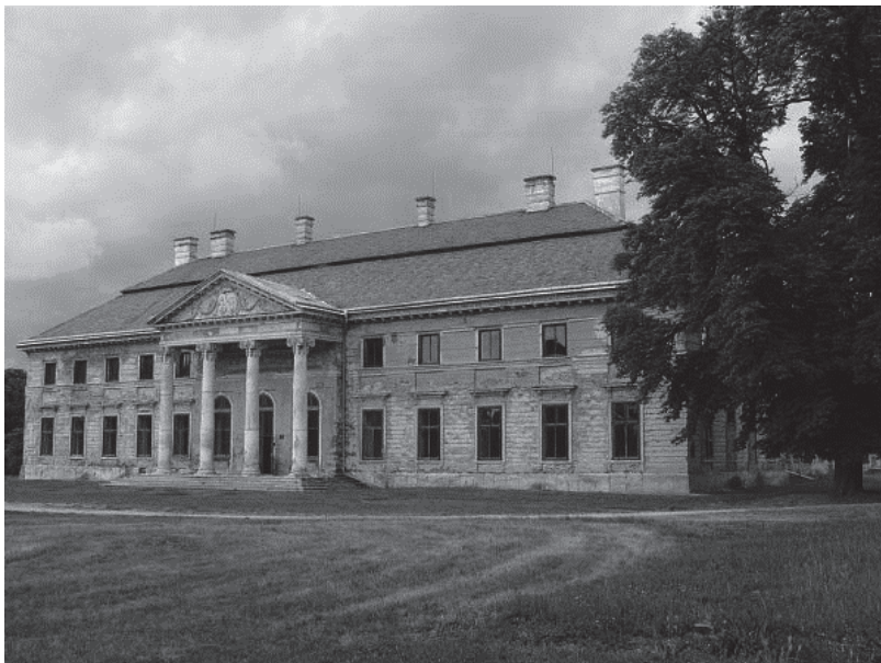
1. kép: A lovasberényi Cziráky-kastély Picture 1. Cziráky Mansion in Lovasberény