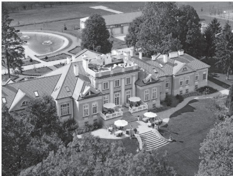
2. kép: A Hertelendy Kastély Kutas-Kozmapusztán Picture 2. Hertelendy Castle in Kutas-Kozmapusztá