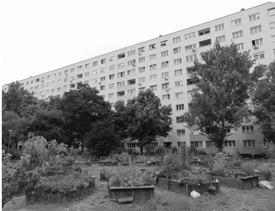
Photo 2. A community garden of a high rise neighbourhood in Budapest