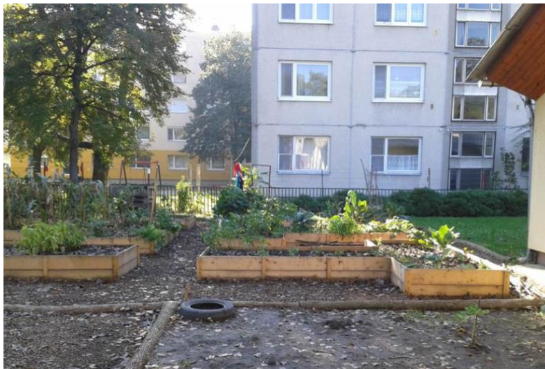
Photo 1. The Megálló Community Garden in Tarján neighbourhood