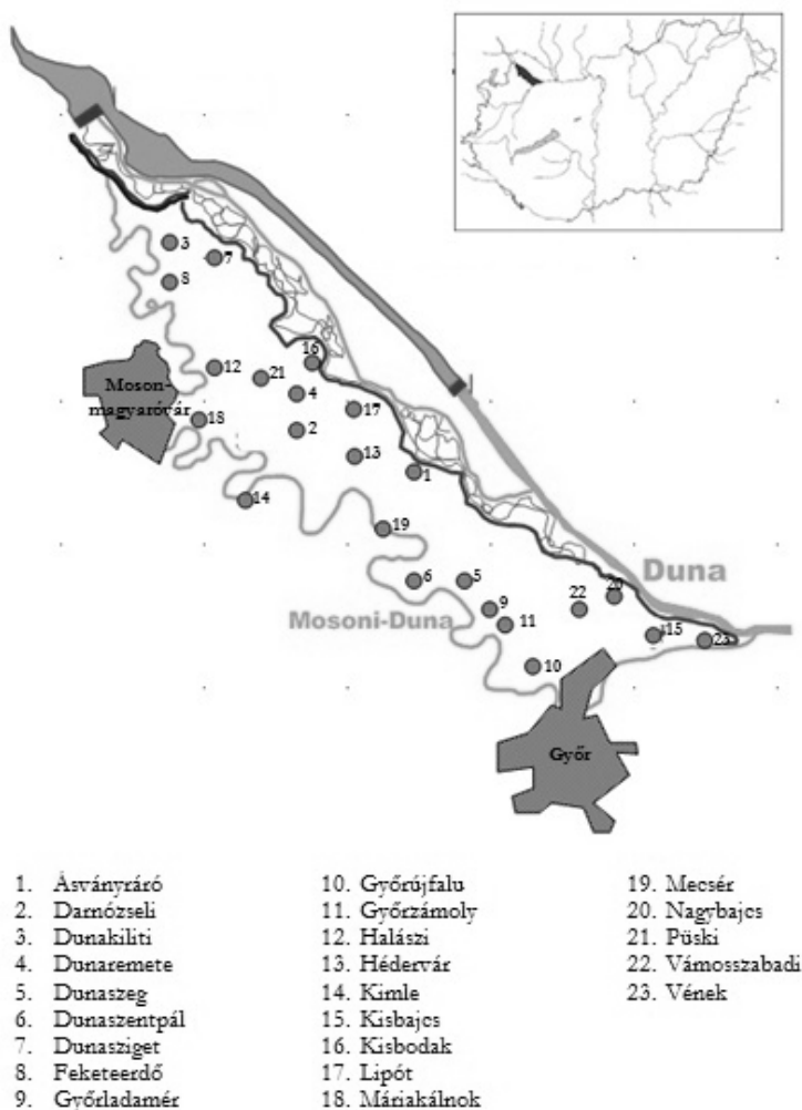
1. ábra: Szigetköz települései Figure 1: The settlements of Szigetköz

Az adatbázis összeállításához szükség volt a történelmi Szigetköz településeinek listájára, majd közülük azok kiválogatására, melyek a mai Szigetköz területén fekszenek. Vizsgálódásunk során szigorúan a Duna (Öreg-Duna, Nagy-Duna) jobb partja és a Mosoni-Duna bal partja által határolt területen lévő településeket vettük górcső alá. Ez alapján napjainkban a lehatárolt térségbe 25 db közigazgatásilag önálló terület tartozik, köztük két város: Győr (a terület DK-i határa) és Mosonmagyaróvár (a terület ÉNy-i határa) (1. ábra).