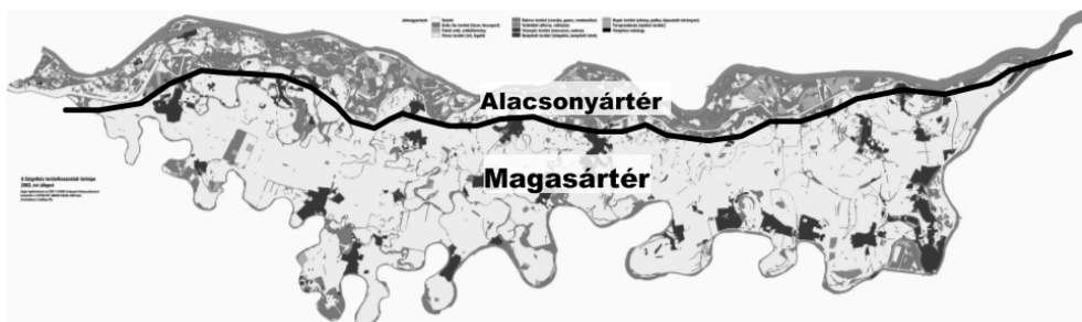
2. ábra: A kistáj alacsony- és a magas ártere Figure 2: The low – and the high flood plain in the micro-region

A Szigetközben annak ellenére, hogy a víz állandó veszélyt jelentett – az árvizek, a medervándorlás, a partszaggatás – az ember már korán letelepedett. A kistáj egy tökéletes síkságnak felel meg, mégis két, egymástól jól elkülöníthető szintet: alacsony ártér, magas ártér (2. ábra), illetve egy szintfoltot lehet megkülönböztetni: futóhomokkal borított területek.