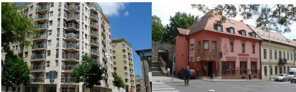
Photo 2 New buildings and functional change