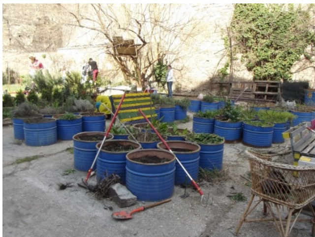
Picture 1. The courtyard of Leonardo garden