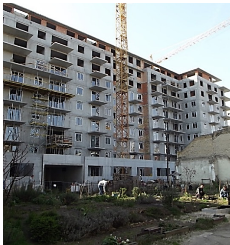
Picture 2. Cultivating in the shade of luxury apartments