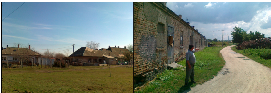
Picture 1. Táplánypuszta and Győrságpuszta manors