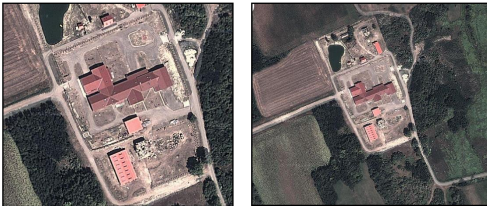
Photo 1: The territory of the tobacco fermenting plant of Lengyeltóti – Pusztaszentgyörgy

Forrás: http://www.maps7.com/hu/8693%20Lengyelt%C3%B3ti,%20Pusztaszentgy%C3%B6rgy%20%C3%A9jsor%20utca%2066,%20Magyarorsz%C3%A1g.html#.VLjmVoCRxwE , 2015-01-16