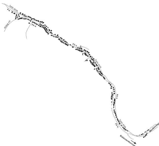
2. ábra: Bükkszentlászló alaprajza napjainkban Figure 2. Bükkszentlászló's map nowadays