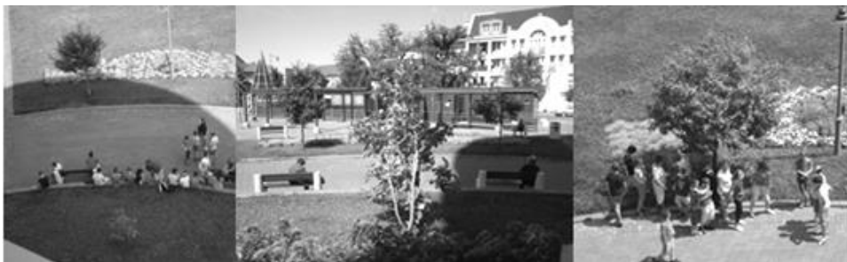
3. ábra: A térhasználat jellegzetességei – árnyékos helyek a téren Figure 3: Characteristics of the square use – Shaded places