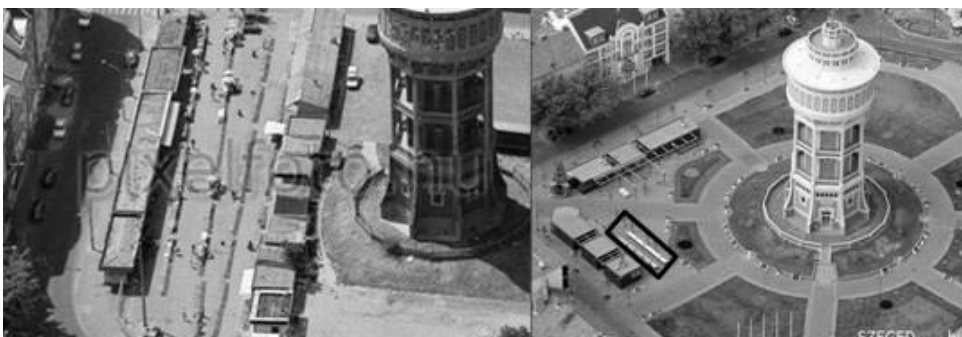
2. ábra: A Szent István tér átalakulása Figure 1: Transformation of Saint Stephen square