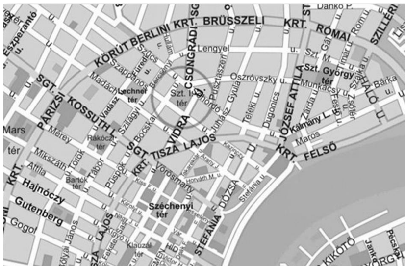
1. ábra: A Szent István tér elhelyezkedése Figure 1: Position of Saint Stephen square