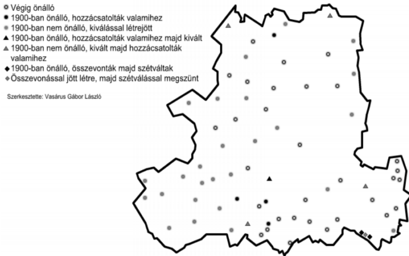
1. ábra: Csongrád megye települései a 20. századi közigazgatási változások típusai szerint Figure 1: Administrative change types of settlements in Csongrád county during the 20 th century

csa, Boglárlelle, Maklártálya, Csanád, Verőcemaros, Szemenyecsrőnye). 13 olyan település is létezik, amely az előző csoporthoz hasonlóan egyesítéssel jött létre, de aztán hozzácsatolással szűnt meg (pl.: Ménfőcsanak, Józsa, Gergelyugornya, Pöse, Padragkút, Tósokberénd, Bárszentmihályfa). Nyolc település közigazgatási beosztása háromszor is változott, összevonással megszűntek, majd szétválással újra önállósodtak, végül újra összevonták őket (Bágyog, Rábaszovát, Bia, Torbágy, Büdszentmihály, Tiszabúd, Tunyog, Matolcs). A kisebb típusok közül említésre méltó a szétválással létrejött Bőny, Rétalap, Kunadacs és Kunpeszér, a szétválással megszűnt Bőnyrétalap, Peszéradacs, Uzdborjád és Zalaszentmihályfa, a Fonyódból kivált, majd újra hozzácsatolt és újra kivált Balatonfenyves (10-es típus). További típusok a kiválással létrejött majd összevonással megszüntetett Gödreszentmárton, Cikolasziget és Sérfenyősziget (13-as típus), az összevonással létrejött, hozzácsatolással megszüntetett, majd kiválással újra létrejött nógrádi Kétbodony és somogyi Ötvöskőnyi (16-os típus). Végül az összefüggő 23-as és 24-es típusok, amikor is Kemenessömjént és Kemenesmihályfát kétszer egyesítették Sömjénmihályfa néven (1939-ben és 1981-ben), majd kétszer szét is váltak (1946-ban és 1991-ben), így ezek a települések váltottak négyszer státuszt a 20. század folyamán.