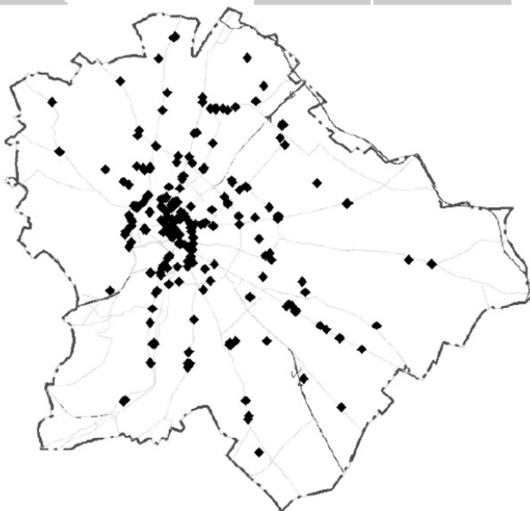
1. ábra: A négy vezető bank fiókjai Budapesten Figure 1: Bank-houses of the four leader banks in Budapest