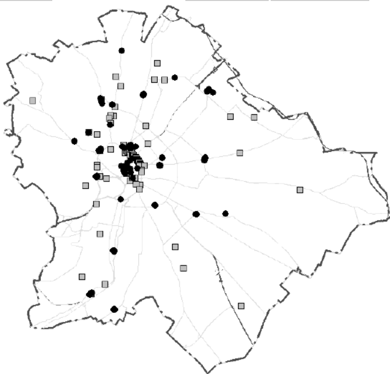
3. ábra: Ékszerboltok (fekete) és esküvői ruhaszalonok (szürke) Budapesten Figure 3: Jewellery shops (black) and bridal shops (grey) in Budapest