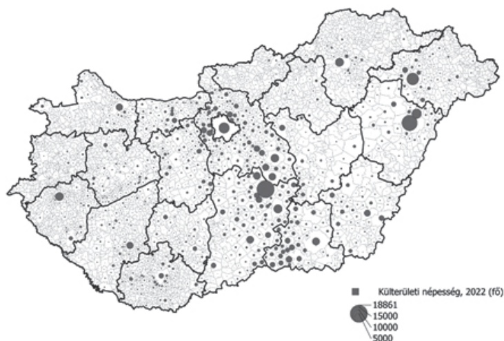
1. ábra. A külterületi népesség száma településenként, 2022 Figure 1. Number of outskirt population by settlements in Hungary, 2022

2011 óta 868 településen nőtt a külterületinépesség-szám, 1078 településen