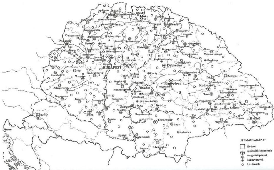
Figure 2. The hierarchy of Hungarian cities in 1910

Forrás: BELUSZKY. – GYÓRI (2003): „A város a láz, a nyugtalanság, a munka és a fejlődés”