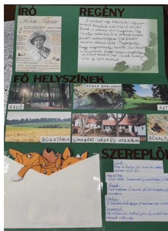
8. kép. Lapbook

Ha ételekről tanulnak, együtt készítenek reggeli, vicces szendvicseket, ha gyümölcsökről, akkor gyümölcssalátát, ha zöldségekről, akkor salátát kóstolhatunk. Ha ruhaneműkről tanulnak, divatbemutatót tartanak, ha a világegyetemről, akkor naprendszermakettet készítenek papírmáséból. Összefoglalások alkalmával „lapbook”-ot (kartonból, színes képekből, különféle kreatív megoldásokkal barkácsolt mű, amely kiváló rendszerezésre) használnak, melynek elkészítéséből mindenki kiveszi a részét, és így tevékenység közben sajátítja el a legfontosabb anyagrészeket (8. kép).