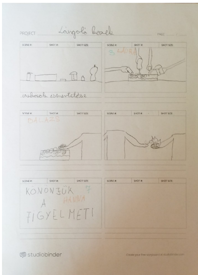
2. ábra: Az iskolai kémiaverseny önálló kísérlettervezési feladatának diákok által készített produktumai

A megyei döntő előtt saját körben szervezett iskolai versenyfordulón előtérbe került a teszt jellegű és gondolkodtató kérdések megválaszolása mellett a csapatmunkában végzett kísérletező, alkotómunka is. A diákoknak különböző sűrűségű és színezésű cukoroldatokból részben saját tervezésük alapján volt lehetőségük szivárványszínű rétegzett többfázisú elegyet készíteni (2. ábra). Rövid időtartamra már itt is megalapozásra kerülhetett a Freinet-pedagógia további, eddig hiányzó pillére, a szabad önkifejezést elősegítő légkör megteremtése.