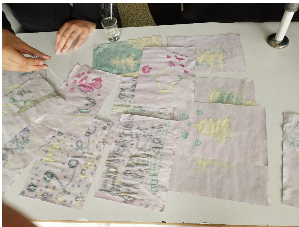
1. ábra: A szakköri foglalkozáson történő tapogatózó ismeretszerzés a vizes oldatok kémhatásáról, környezeti nevelés a vöröskáposzta levének indikátor tulajdonságának szemléltetésével

ként vállalt óraadói tevékenység, kiegészítve a mentorként végzett tehetséggondozással organikus módon illeszkedik az iskolai élet szövetébe. Egy nagy lépéssel közelebb kerülnek az érdeklődő, tehetséget mutató – „csillogó szemű” – diákok az egyéni fejlődést támogató környezethez. Az ilyen kiscsoportos, tanórán kívüli foglalkozásoknak kitűnő keretet kínál a Freinet-pedagógia koncepciója (Petersen, 1998) is: olyan légkör teremthető, ahol egyaránt szerepet kap a kooperatív tanulás, a kísérletező tapogatózás és a környezeti nevelés (1. ábra). A tanórán kívüli, mentorálás keretében történő szakköri munkához ki kell jelölni egy célt. A kísérletezés az alapja és elindítója az együttműködésnek. Kell valamilyen középtávú célkijelölés is, aminek eléréséig az egyéni fejlődési utakat be lehet járni. Ilyen célnak tűnt a korábbi saját tapasztalat alapján egy tanulmányi versenyen való részvétel és az arra való felkészülés.