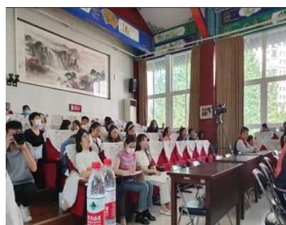
1. ábra: Demonstrációs óra egy pekingi iskolában

A tanulásnak az a formája, melynek keretét a tanórák közönség előtt történő megtartása adja – ami természetes része minden kínai pedagógus szakmai életének – különös lehetőségeket rejt magában. Az ilyen órákra történő, általában kollektív felkészülés (beleértve a próbákat) és az ezeket követő viták a tacit és az explicit tudás egyidejű megosztását teszik lehetővé. Bár a szakmai közönség előtt történő szereplés, különösen eleinte, természetesen szorongáskeltő is lehet, ahogy erről több interjúrészlet tanúskodik, pozitív hatással van a pedagógusok önbizalmára és énhatékonyságára. Ez nemcsak a szűkebb értelemben vett szakmai tanulást teszi lehetővé, hanem a személyiség fejlődését és a szakmai identitás erősödését is.