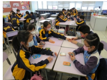
3. ábra: Jelenetek egy hongkongi iskola életéből

A képeken látható iskolában alkalmazott kurrikulum és az ehhez kötődő taneszközök szinte teljesen az iskola pedagóguskollektívájának alkotásai, és ebbe az alkotási folyamatba a tanulókat is bevonják. Az intézményben egyfajta innovációs burjánzást lehet megfigyelni, ami a tudatos jelenlétnek ( mindfulness ) azzal a magas szintjével jár együtt, amit az emberi tanulás melegágyának tekinthetünk. A pedagógusok szinte folyamatosan az élénk figyelem állapotában vannak, mindennapos tapasztalatuk az, amit sokan a „flow-élmény” fogalma alatt értenek. Az ilyen intézményekben már nem lehet különválasztani a tanulást az egyszerű jelenléttől vagy otléttől. Az a hongkongi környezet, melyben találkozunk az iskolai önállóság kitágulása, a tanári kreativitás és a bottom-up innovációk támogatása, a minőségkultusz és a versengés, kedvez az ilyen szervezetek kialakulásának.