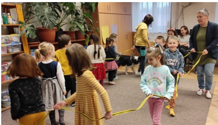
2. kép. Állatasszisztált oktatás