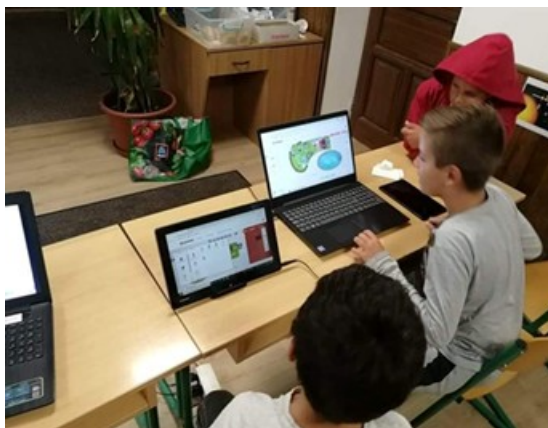
1. kép. Veteményes kert tervezése, virtuális kerttervező programmal

A gyerekek komolyan vették a feladatot, fejlődött együttműködésük, s alkalmazták mind matematikai, mind környezetismereti tudásukat. A projekt zárásaként egy kolléganő saját kertjében a permakultúras művelést is kipróbálhatták, tanulmányozhatták a gyerekek, majd az iskolában is nevelhettek közösen ültetett paradicsom- és paprika palántákat.