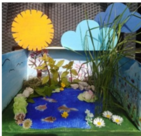
5. kép. A tópart élővilága

A közeli halastavak lehetőséget adnak a víz és a vízpart életközösségének tanulmányozására. Megfigyeljük a halak, a békák, a siklók mozgását, a vízi madarakat, a vizet körülvevő növényvilágot, kipróbáljuk a horgászatot. A kirándulás után kreatívan dolgozzuk fel a látottakat képi megjelenítés, lapbook vagy makett formájában (5. kép).