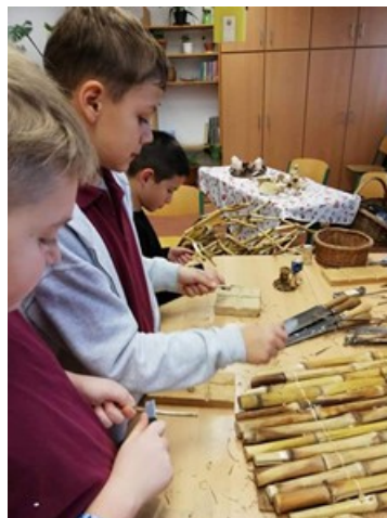
3. és 4. kép. Hagyományainkhoz kapcsolódó kézműves foglalkozás