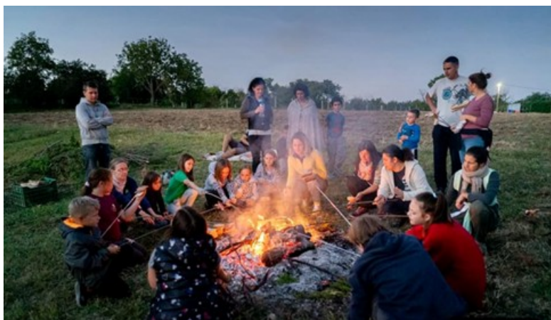
6. kép. Családi szalonnasütés, éjszakai túrával, szarvasbögéssel (Forrás: Saját készítésű kép)

A legkedveltebb programunk a családi szalonnasütés szarvasbögéssel, éjszakai kirándulással. A Zengő-hegy és vidéke nem csak növény-, de állatvilágban is rendkívül gazdag. Az itteni gyerekeknek nem kell állatkerthbe menni, hogy őzet, szarvast, rókát, esetleg vaddisznót lássanak. Ősszel a szarvasbögés időszaka mégis különleges, talán kissé félelmetes is, de pont ezért olyan izgalmas. Ezért az új tanév elején egy szülővel, testvérekkel közös, csapatépítő, ismerkedő kirándulást szervezünk. Közös tűzgyújtással, szalonnasütéssel, beszélgetéssel kezdjük a programot, sötétedés után indulunk feljebb az erdőben egy sétára, lámpákkal, csendesen, hogy halljuk a szarvasbikák különleges hangját (6. kép).