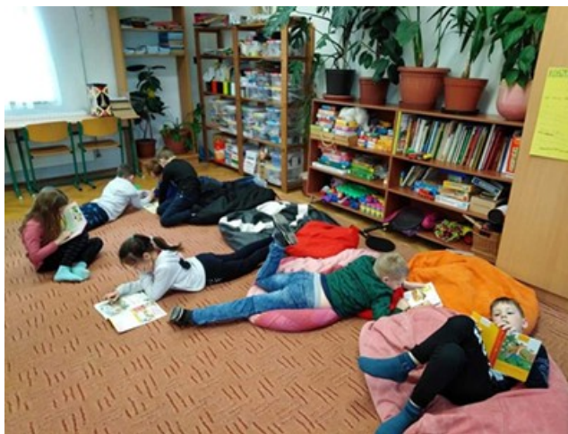
7. kép. Csendes nap.

Ezen felül úgynevezett csendesnapokat is tartunk, amelyek pedig lelki életüket, feltöltődésüket szolgálják táplálva erkölcsi, érzelmi világukat (7. kép).