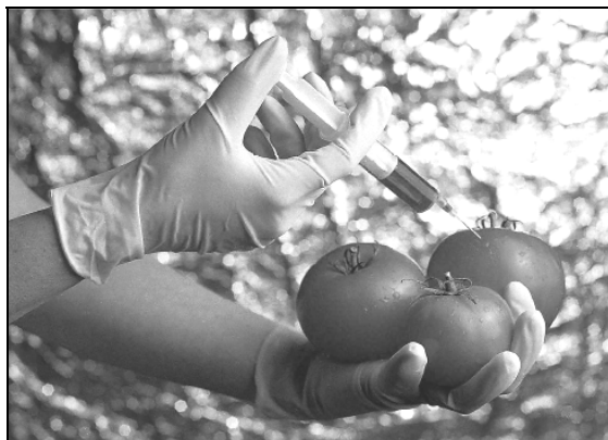
2. ábra: Ausztriában a genetikailag módosított élőlényekkel kapcsolatos tipikus képi ábrázolás

Középpontba a megküzdés fogalmát helyezik, ami nem hiányzik a szociális reprezentáció elméletéből sem, hiszen az ismeretlen megszelídítése Moscovici eredeti elképzelései szerint is központi motívuma a közösség reprezentációs törekvéseinek. A pszichológiában általánosan használt megküzdés fogalmával való rokonságot annyiban megerősítik, hogy az általuk leírt kollektív forma is többé-kevésbé tudatalan, nem kontrollált folyamatokat igyekszik megragadni, még ha tartalmaz is megismerési összetevőt. Természetesen a kollektív megküzdésben is alkotó részt vállalnak az egyéni törekvések, nem kizárólag az individuum feje fölött zajlanak ezek a folyamatok sem. Hangsúlyozzák azonban a média szerepét, amely a szenzációt keresve az újat figyelemre méltónak, a szokásokkal, a meglévő helyzettel szemben kihívást jelentőnek állítja be.