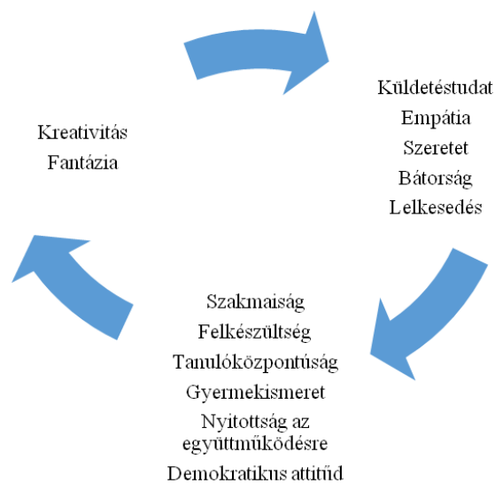
2. ábra: A mesét író tanuló tanárok személyes tulajdonságai

A mesét író inkluzív tanárok személyes tulajdonságai is feltárulnak a meséhez kapcsolódóan. A szakmaiság, a pedagógiai szakmai tudás mellett implicit, vagy explicit formában a mesék gazdag, változatos személyiségbeli karakterisztikus jellemzőket is hordoznak (lásd 2. ábra). Nem véletlenül választották e speciális utat, azaz az inkluzív tanárságot, mely mintegy a jövőre, egy távoli vízióra készít fel.