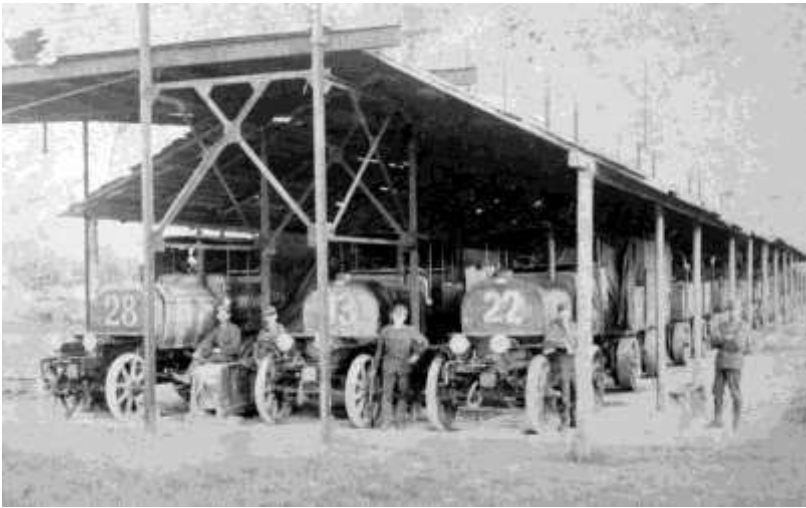
Fig 10.: Benzo-electric railway trains

Photo of Gusztáv Mitterspacher. Budapest, Library of Military History