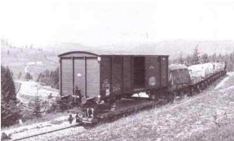
Fig 11.: Transportation of normal gauge cargo wagon through the Carpathian Mountains

Photo of Gusztáv Mitterspacher. Budapest, Library of Military History