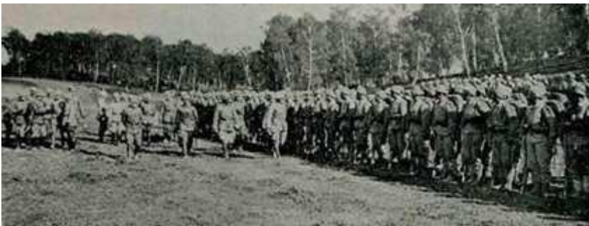
Fig 7.: Inspection of Pasha Enver and Kaiser Wilhelm 20 th century