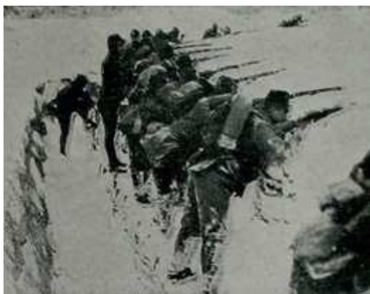
Fig 8.: Turkish troops in the snow of Galicia 20 th century