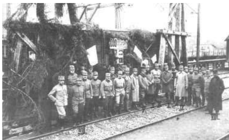
Fig 13.: Transportation of the 1000th train. Photo of Gusztáv Mitterspacher. Budapest, Library of Military History