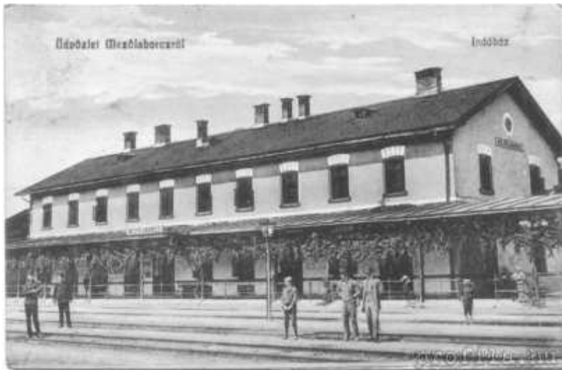
Fig.2.: Railway station of Mezőlaborc Contemporary postcard