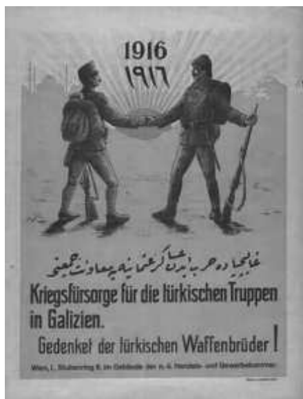
Fig 9.: Poster saying goodbye to Turkish troops returning home 20 th century