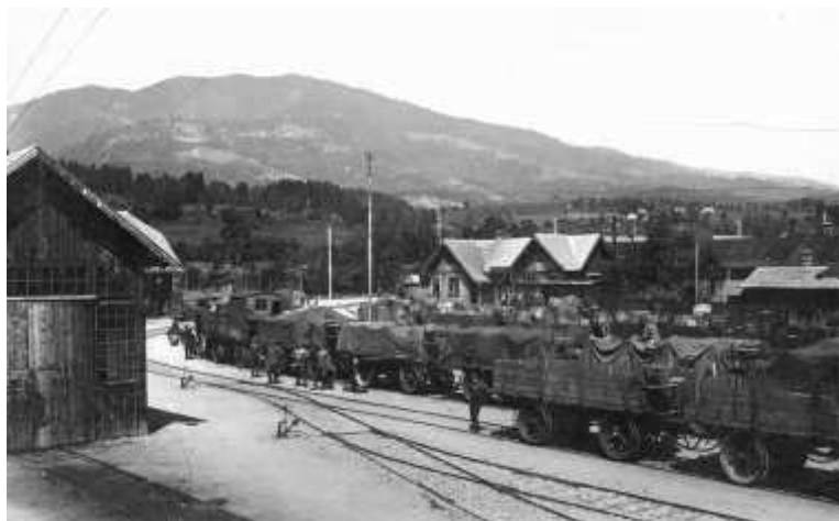
Fig 12.: Borgóprund terminal station Photo of Gusztáv Mitterspacher. Budapest, Library of Military History