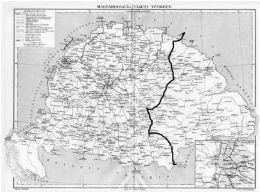
Fig 4.: The deployment of Turkish troops through Hungary on the railways of the MÁV (1916) Contemporary MÁV network map – with markings from the author