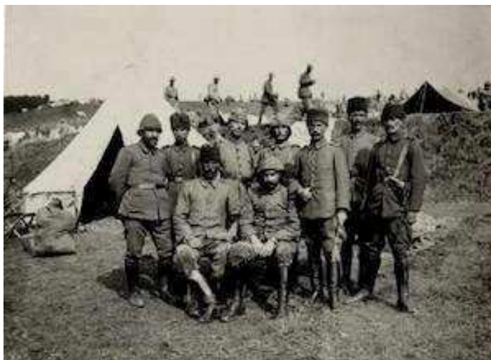
Fig 5.: The Turkish military staff on the eastern front 20 th century