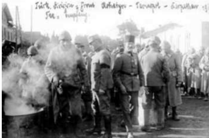
Fig 6.: The separate front kitchen of the Turkish troops 20 th century