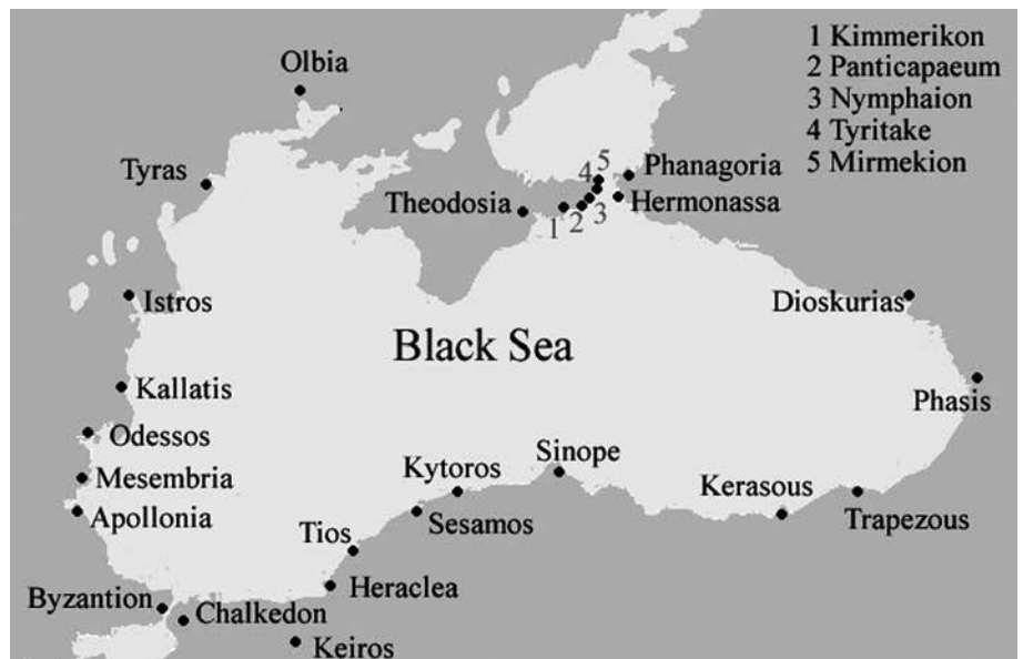
A Fekete-tenger és jelentős városai

A Fekete-tengeri régió fontos élelmiszerforrást is jelentett az ókorban. A tengeren nagy volumenű halászat folyt, míg a partokon és a folyók mentén földműveléssel foglalkoztak. A rómaiak is importálták a már említett pontusi mogoróból és a különféle magvakból. A területről az egyik legfőbb és legismertebb export a sózott hal volt, amelyet a birodalmon belül szinte mindenhol szállítottak. 12 Strabón leírja, hogy az Azovi-tenger és a Kercsi-szoros jege alól nagy halakat fognak ki (VII. 3, 18), és sópárlókat is említ (VII. 4, 7).