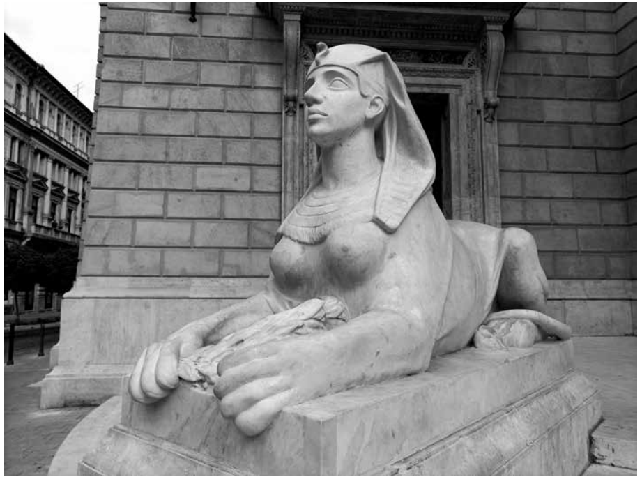
7. kép. Az Operaház bejáratát őrző márványszfinxek egyike, Stróbl Alajos, 1884

és a 20. század művészetében már nem mindig volt alkalmas – ahogyan a végzet asszonyának ábrázolásához egyes szimbolisták is lecserezték az oroszlánt macskafajtákra. Ady írásában – amelyik a három közül a legkorábbi – a főszereplő egy név nélkül említett muzsik, a szfinxnek pedig (amelyik „egy csúrszerű középület előtt meredt” és a „hátán néha utálatos, részeg fickók” lovagoltak) sem nőiségére, sem érzékiségére nem találunk utalást. 61 Nem is állat, hanem egy fenséges lény, a titkos tudás szimbóluma, akit azonban az emberek állatnak tekintenek, ahelyett, hogy „a Végtelenről és az örök Titokról” álmodnának. Bár az operaházi szfinxek eredeti szimbolikájukat tekintve a színpadi művészet jelképei, a fenti novellákban a szfinx hagyományos univerzális, a lét nagy kérdésének a titkát őrző szerepe a hangsúlyos, amire a szerzők közvetett módon, ennek megszenteltetésével utalnak. Ebben a szimbolikában az állati aspektusnak csak marginális szerep jut, és azt sem az oroszlánalak képviseli, hanem a ló, amely nemcsak Kabosnál jelenik meg, hanem utalásszerűen Krúdynál is. Miután a szfinx leveti Adyt a hátáról, az őt kísérő „Jóbarát”, vagyis Krúdy, csak annyit jegyez meg: „Kancarúgás nem szégyen!”.