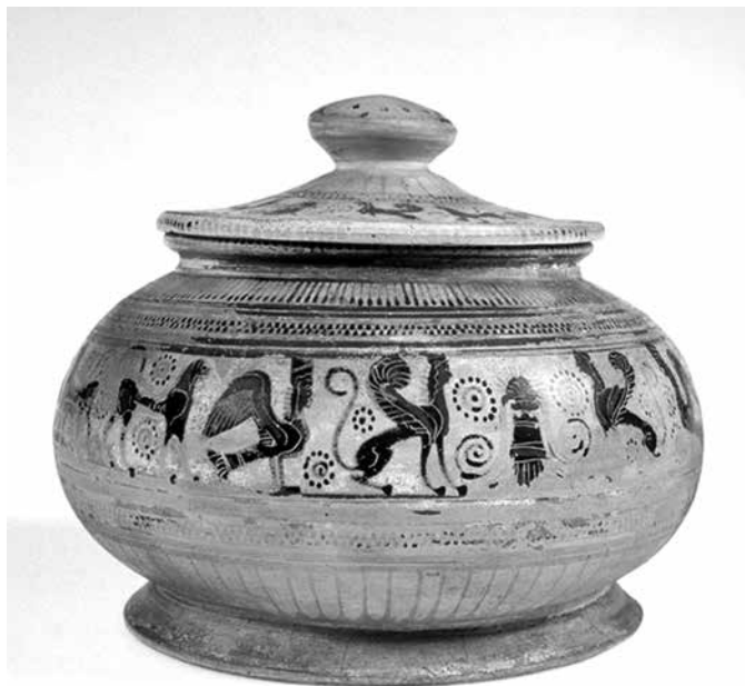
2. kép. Állatfrízes korinthosi pyxis szfinxábrázolással, Kr. e. 585–570 (Szépművészeti Múzeum, Antik Gyűjtemény, ltsz. 50.251.1-2)

tozatos, sajátos típusait és példányait alkotta meg, amelyek az állati és az emberi jegyeket az aktuális jelentéshez igazodva eltérő módokon hangsúlyozták.