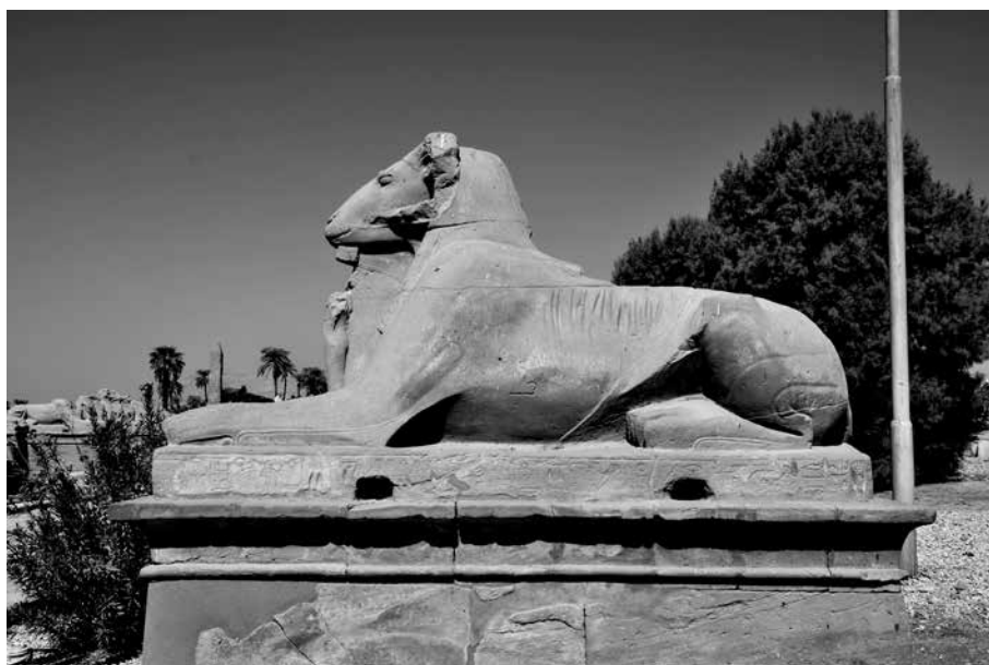
3. kép. Kosfejű szfinx a karnaki templomhoz vezető úton

A szfinxmotívum keleti hatásra, elő-ázsiai közvetítéssel került a görög művészetbe. 10 Már a Kr. e. 8–7. századi archaikus vázákön szerepelnek szfinxek állatfríz részeként. A görög mitológiából jól ismert, a Théba lakosait találós kérdésével rettegésben tartó, a várostól naponta emberáldozatot követelő