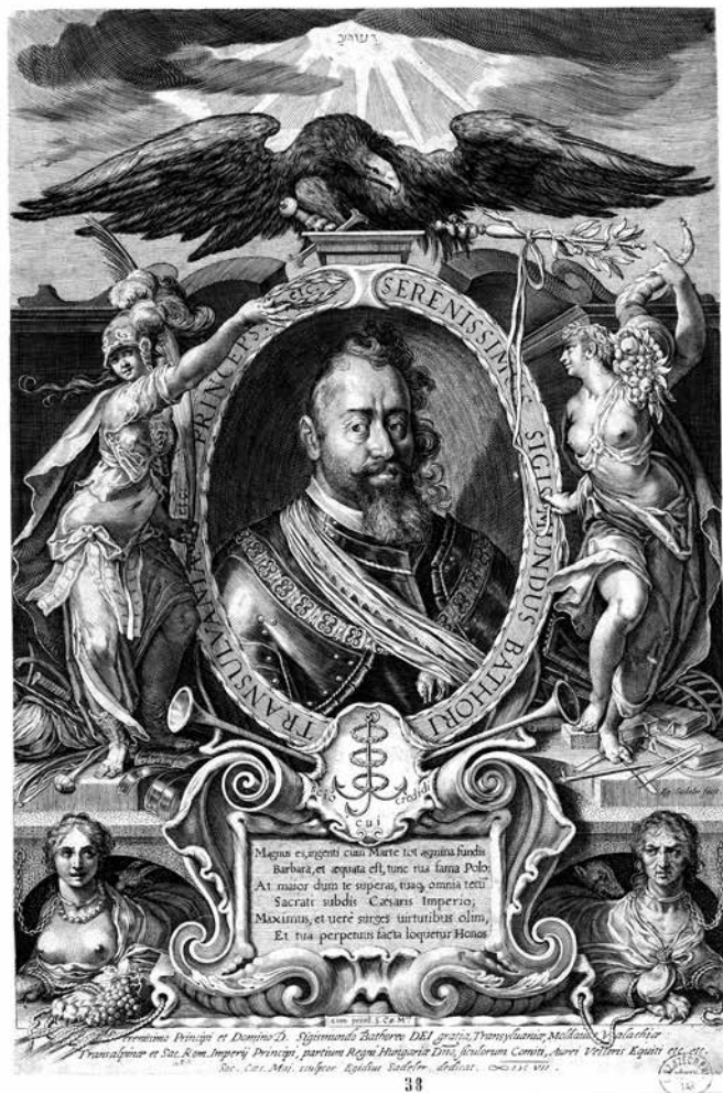
6. kép. Báthory Zsigmond erdélyi fejedelem portréja, készítette Aegidius Sadeler, 1603 (Országos Széchényi Könyvtár, Régi Nyomatványok Tára) https://regiritka.oszk.hu/apponyi-metszetek/bathori-zsigmond-portreja-3/

A leggyakoribb típus Magyarországon a nemesz -kendős, fedetlen női kebelrel, néha női arcvonásokkal, máskor semlegesebb arckifejezéssel ábrázolt, a hagyományos statikus egyiptomi pózban fekvő szfinx volt. Ez a típus megjelent parkokban, mint például a hegyfalui kastély kertfelőli bejárata előtti két szfinxpár, 54 vagy az egykor a nagykútaai Keglevich-kastély kertjében található, az 1950-es években a tápiószelei Blaskovich Múzeum kertjébe átszállított szobor. A nagykútaai szfinx-