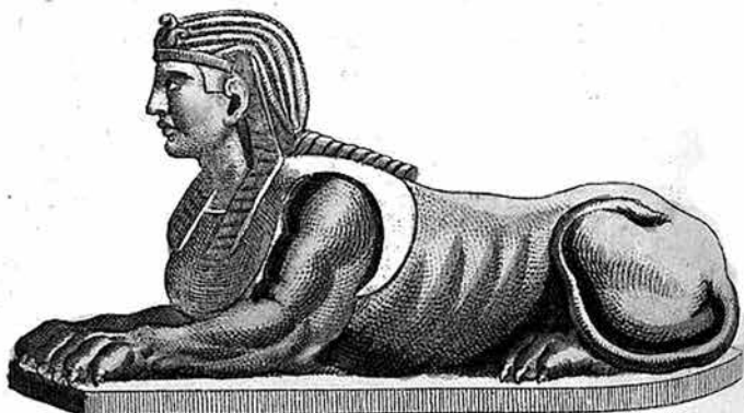
4. kép. Friedrich Justin Bertuch gyermekek számára írt képes enciklopédiájában a görög és az egyiptomi szfinx ábrázolása (Bertuch 1801)