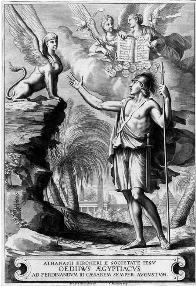
5. kép. Athanasius Kircher Oedipus Aegyptiacus c. könyvének címlapja (Kircher 1652–1654)