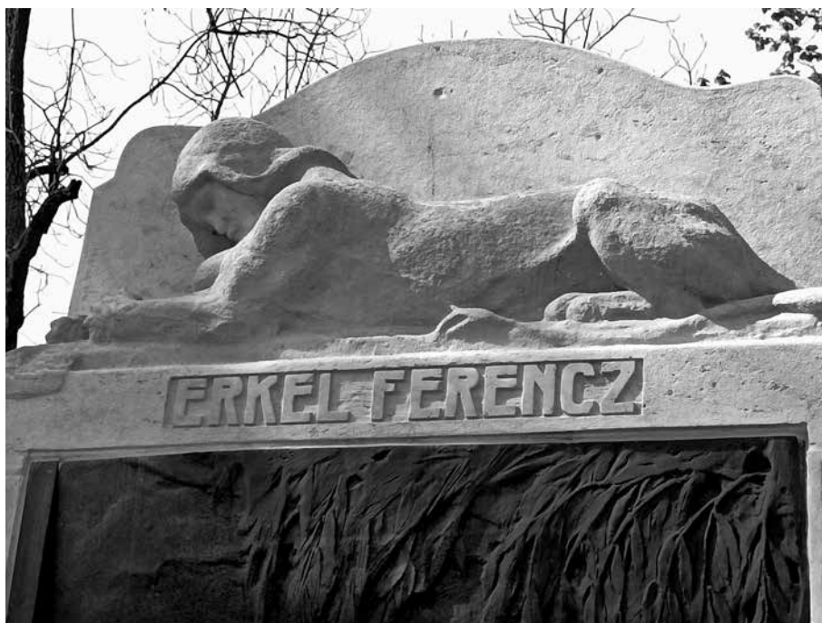
9. kép. Szfinxábrázolás Erkel Ferenc síremlékén, Kallós Ede, 1904