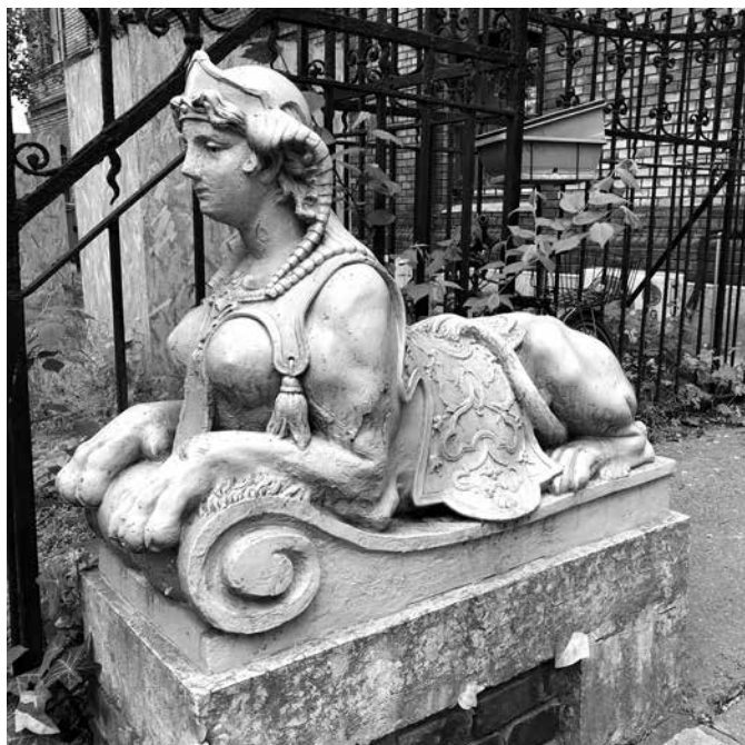
8. kép. A Semmelweis Egyetem II. sz. Patológiai Intézetének bejáratát őrző szfinxek egyike