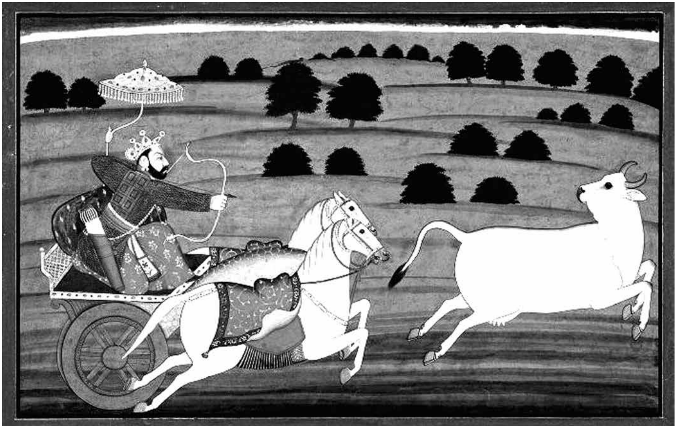
1. kép. Prithu üldözi a tehénné vált Földet. Illusztráció a Bhágavata-purāṇa kéziratából, India, 1740 körül

A Vēna karjából született Prithu az első pillanattól kezdve elődje ellentétéként, a tökéletes uralkodó mintájaként jelent meg, 12