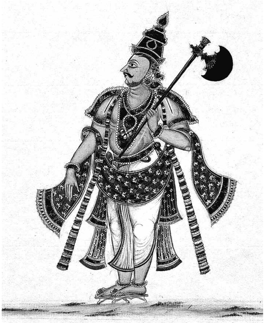
2. kép. Parasuráma. Papírra festett festmény egy hatvanhárom istenséget és a mindennapi életet ábrázoló álló gyűjteményből. The British Museum (Museum Number 2007, 3005.43)

Bölcs Brahmá, a Haihaják családjában születtek olyan bikához hasonló ksatriják, akiket a védelmembe vettem. Engedd meg, hogy oltalmazhassanak engem! Nagy tudású uram, a Púruk sarját, Vidúratha fiát a Riksavat-hegyen medvék nevelték fel. Szaudásza fiát együttérzéssel eltelve az áldozatok mérhetetlen erejű bemutatója, Parásara mentette meg. A bölcs minden feladatát szolgáló módon teljesítette, és ezért