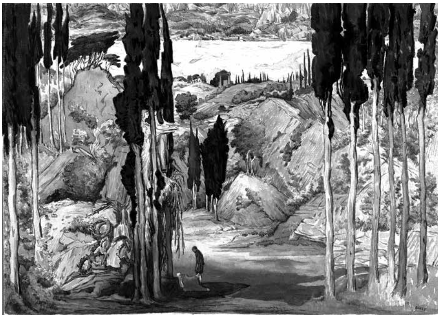
1. kép. Daphnis és Chloé. Dísztetterv az első felvonásból. MS Thr 414.4 (9), Harvard Theatre Collection, Houghton Library, Harvard University