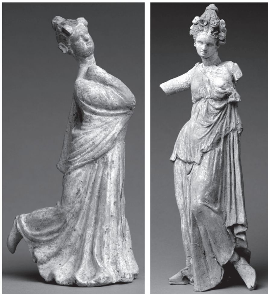
3. kép: A két táncoslány egymás mellett: fókusz a jobb oldalakon © Metropolitan Museum of Art / Public Domain