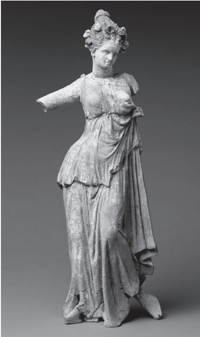
2. kép: Lányt ábrázoló szobor Tarasból (Kr. e. 3–2. század)

hezedik, csipőjét így hangsúlyosan tolja ki oldalra. Finoman hajlítja be bal lábát, amely ebben a pózban hosszabbnak tűnik. Combjai szinte összesimulnak, de két térde nem ér össze: bal lábfejét oldalt hagyta, lábujjai a talajt érintik.