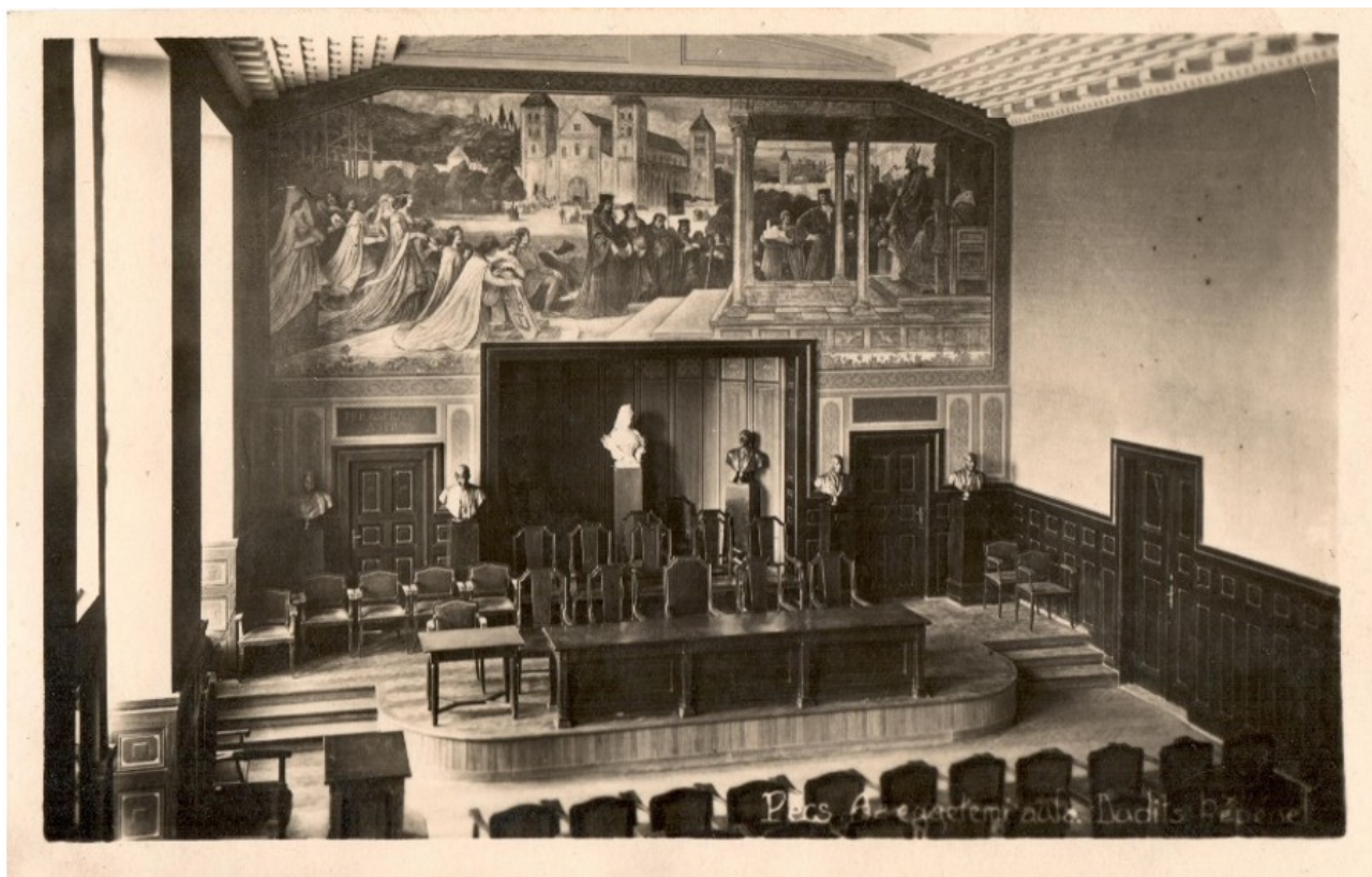
3. kép: A Magyar Királyi Erzsébet Tudományegyetem díszterme Pécsen a névadó szobrával.

A királyné nevét viselő iskolák sorában fontos kultuszápoló szerepe volt az 1914-ben alapított pozsonyi Magyar Királyi Erzsébet Tudományegyetemnek, ahol a névválasztás indoklásában megjelent mítoszának három eleme: Erzsébet királyné magyarok iránt érzett rokonszenve, a kiegyezésben játszott szerepe, illetve az Árpád-házi Szent Erzsébet tiszteletével való összefonódás. Az utóbbit a helyszín, Pozsony is erősítette mint a szent egyik lehetséges születési helye, kultuszának központi helyszíne, de az egyetem az 1923-i Pécsre költözése után (3. kép) egészen 1945-ig megtartotta nevét (Polyák, 2014) és a hozzá kapcsolódó hagyományokat és jelképeket.