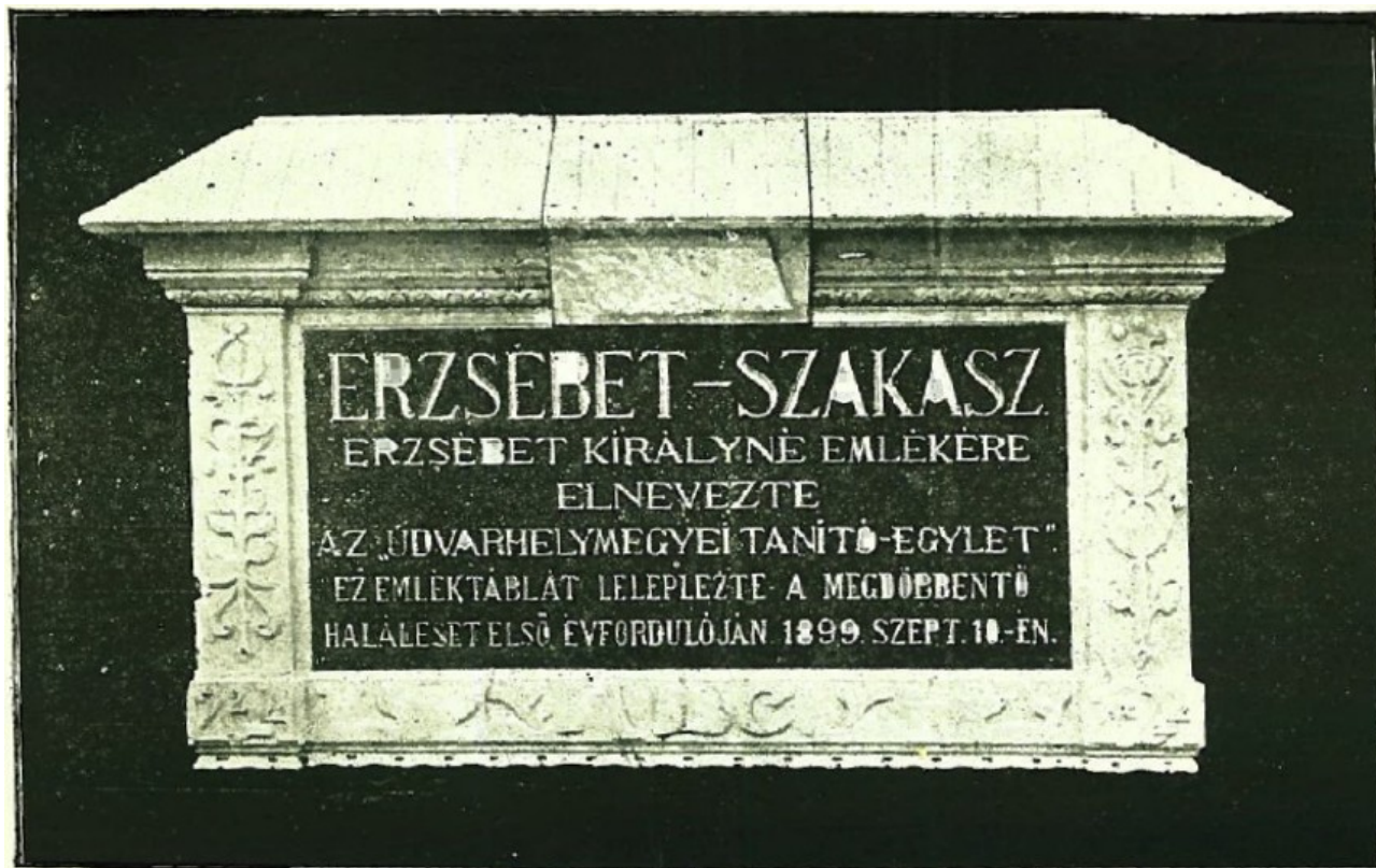
2. kép: Emléktábla a homoródalmási barlangban (Szász, 1899)