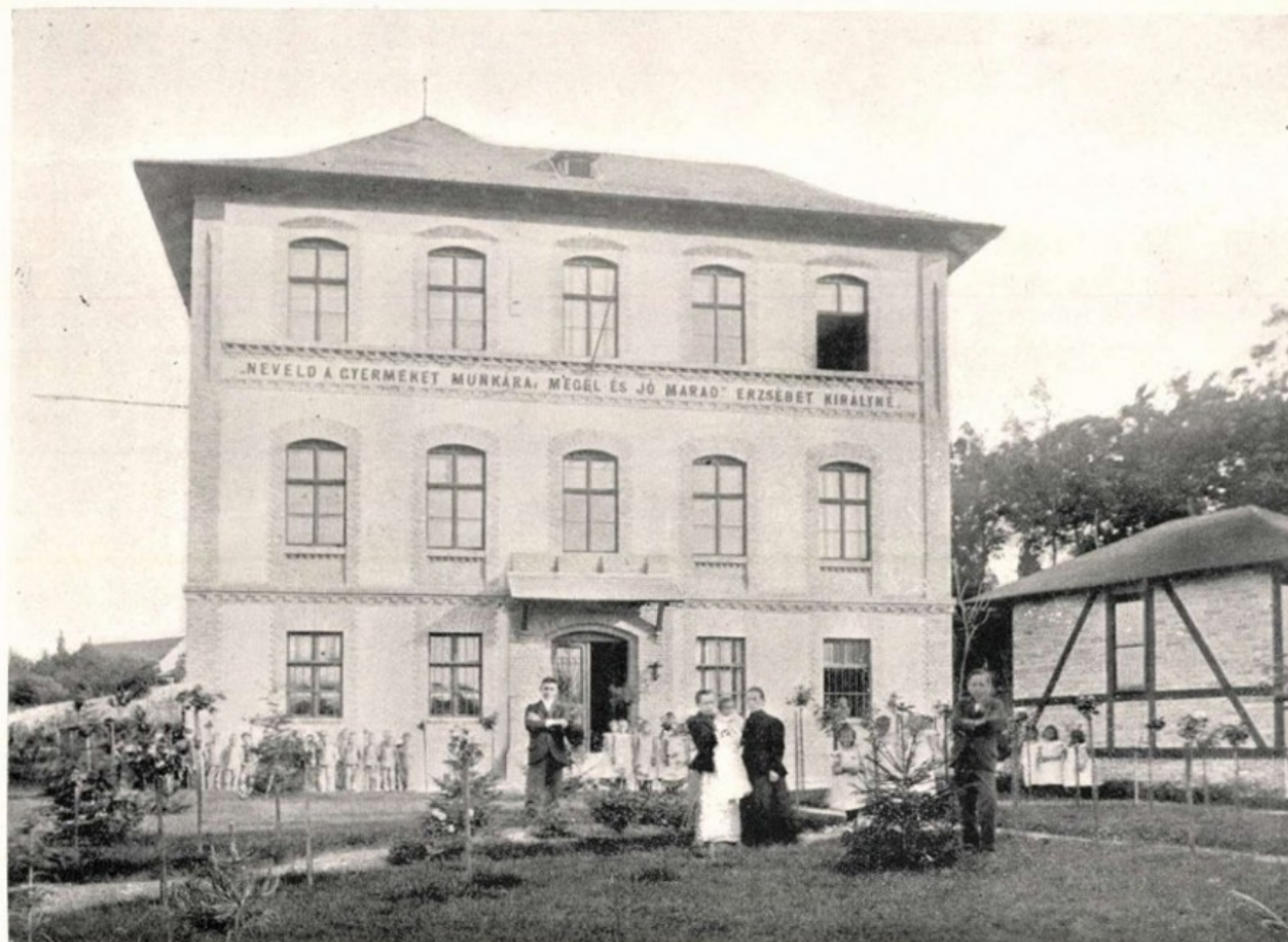
4. kép: Erzsébet-otthon Budaörsön (A Nagypénteki Református Társaság hetedik évkönyve, 1902)

intézményhez, ahogy az avató ünnepélyen a király képviselőjében Széll Kálmán miniszterelnök beszédében is összekapcsolta az árvaház céljait a névadó személyével: „a hány szív és lélek megmarad erkölcsösnek és vallásosnak és ahány hazafiassá nevelődik, és az marad, megannyi emléket állítanak önök a mi dicső királynénknak, a legszebbeket, a legmaradandóbbakat, a legértékesebbeket” (Az „Erzsébet-ház” felavatása, 1900).