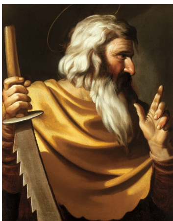
4. kép: Caravaggio: Szent Simon (1600 körül)