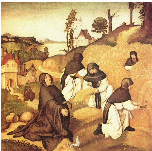
3. kép Id. Jörg Breu: Ciszterci szerzetesek aratás közben (1500)

25) így ír: „A szerzetesi élet az elszakadás élete. A szerzetes nem ragaszkodhat semmihez ezen a világon, hogy teljesen Istené lehessen. Ez az alapelv vezethetett odáig, hogy elhagyták az eredeti nevet egy új névért, amely kifejezi a Krisztussal való új élet bensőségességét. A szerzetesi hivatás kiemeli az embert a vér szerinti családból és az egyházon belül belehelyezi egy nagyobb, teljesebb családba, amely Jézus Krisztus szeretete által jön létre. Ezt a változást fejezheti ki az új név.”