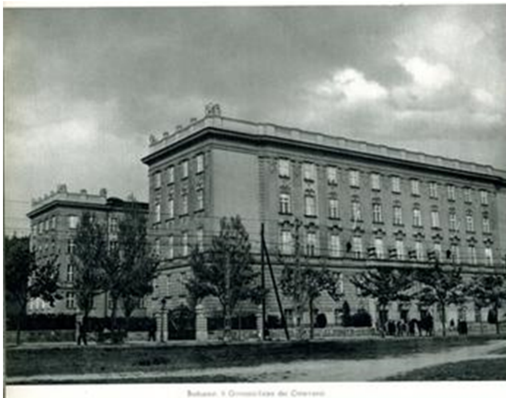
7. kép: Szent Imre Gimnázium 1938-ban.