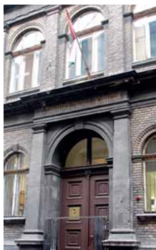
2. kép: A Mintagimnázium bejárata.

A Mintagimnázium 1873-ban Kármán Mór terve alapján jött létre a leendő tanárok gyakorlati képzésére. Ahogy az alapító okirat fogalmaz: „...oly mintaszerű iskolai életnek adja képét, amelyben a tanítványok erkölcsi és értelmi haladása az egész tantestület gondját képezi, és mely a tanárjelöltnek buzdító példaul, a tanárnak lelkesítő emlékül szolgáljon” (Schiller, 2012). Az intézménynek önálló épülete csak 15 évvel később lett. A teljes nyolc osztályos gimnázium az 1913/14-es tanévre épült ki. Pesztalics Lajos azt láthatta, hogy az intézményben sok tanári szoba található, hogy mód legyen a jelöltekkel foglalkozni. Különösen kedves lehetett számára a fizika előadó, amely „egyetemi tantermet idézett emelkedő padosaival, vetítési lehetőségével, a kísérletekre berendezett tanári asztallal. Mögötte meglehetősen gazdagnak látszó, tágas szertár ... [Jól felszerelt volt a kémiai előadó is, amely] „két hosszú laborasztalból állt, készen a diákok kísérleteire, oldalukból írólapokat lehetett kihúzni” (Schiller, 2012).