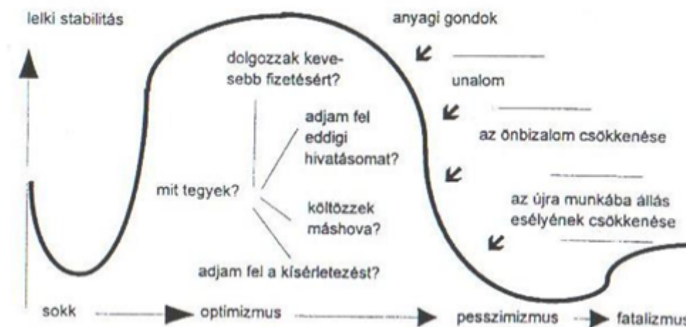
2 ábra: A Borgen-Amundson modell

A következő vizsgálati módszerünk az érzelmi változásokat jeleníti meg közvetlenül a lemorzsolódás idején, a lemorzsolódást követő napokban, majd három illetve hat hónap leteltével, végül pedig az újratanulás idején (3. sz. ábra).