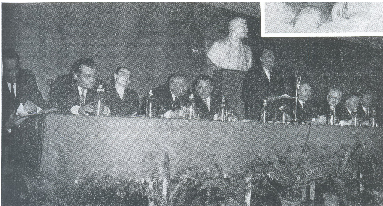
Makarenko halálának 25. évfordulóján tartott emlékünnepegség elnöksége az Építők Rózsa Ferenc Művelődési Házában (1964)

leszkedik, mely 1965-ben, egymást követő lapszámok hátsó és belső borítóján jelent meg a Köznevelésben. A sorozat címe: „A pedagógia műhelyei”, példánk az MTA Pedagógiai Bizottságát mutatja be munka közben. Nem véletlen a megjelenés dátuma – ebben az évben hangsúlyos helyeken ünnepelte a szaksajtó a felszabadulás 20. évfordulóját, mely alkalmat adott a visszatekintésre, az eredmények összegzésére – Assmann kulturális emlékezetről szóló elméletében ( Assmann, 2004 ) az ilyen évfordulók, az ehhez kapcsolódó cselekvések és gyakorlatok a kollektív emlékezet és identitás megformálásában játszanak fontos szerepet. A szocialista rendszer számára 1945 az a referenciális pont, kezdet, amihez képest önmagát meghatározza, az eredet, ami köré mítoszt épít. Most lássuk tehát a konkrét képet és a kontextust, amiben a Makarenko-emlékünnepegség megjelenik!