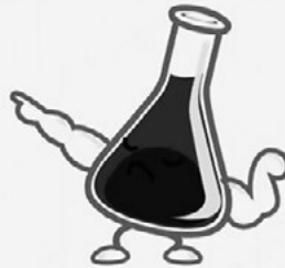
1. ábra. A TED-Ed kezdőlapja

a benne rejlő oktatási lehetőségekről. A megértést segíti, hogy a weblap ezen oldalán található menüpontban ( Try it out ) lépésről lépésre kipróbálhatjuk a videóalapú feladatok készítését.