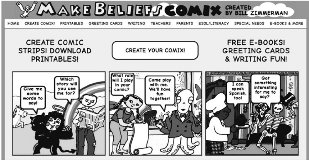
1. ábra. A Make Beliefs Comix kezdőlapja

SNI-s diákok oktatására ( Special needs ) is biztosít a weboldal számos ötletet, végül pedig elérhető egy e-book bank (E-books & more) .