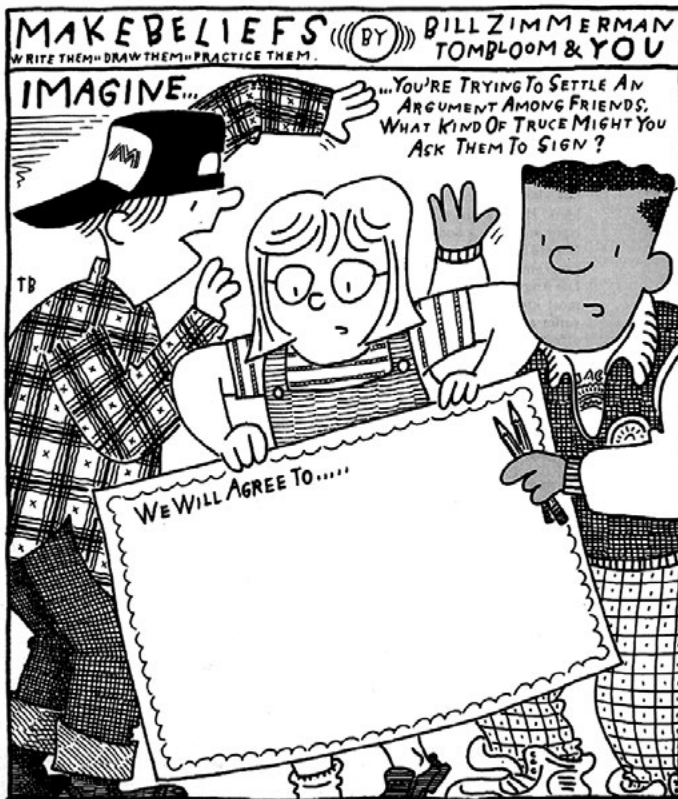
3. ábra. Példa a Make Beliefs Comix nyomtatható anyagaira a barátság témából