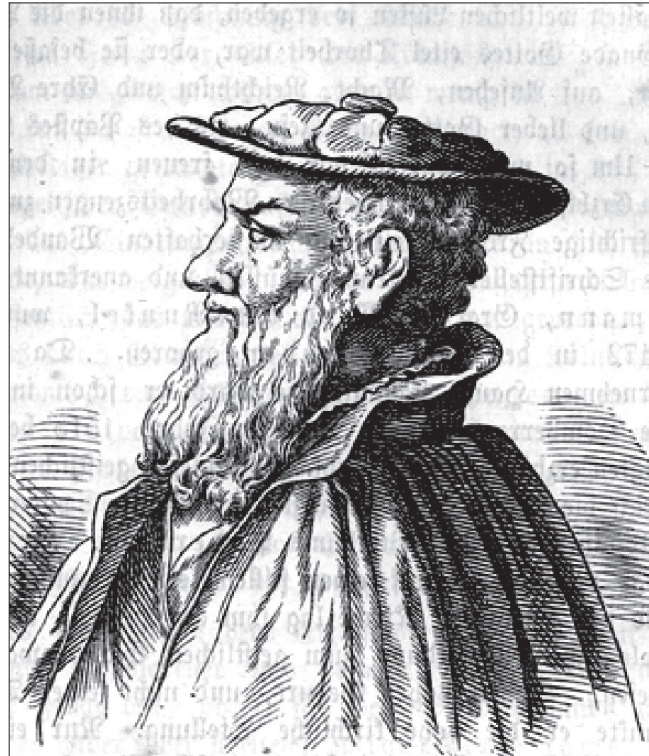
Hermann von Wied (1447–1552) kölni érsek (1515–1546) 49

A kölni szentszék jegyzői irodáján dolgozott egy csoport, amelynek tagjai a jegyzőkhöz sorolódtak ( Bankale ), s számukat Dietrich von Mörs húsz főben állapította meg. 54