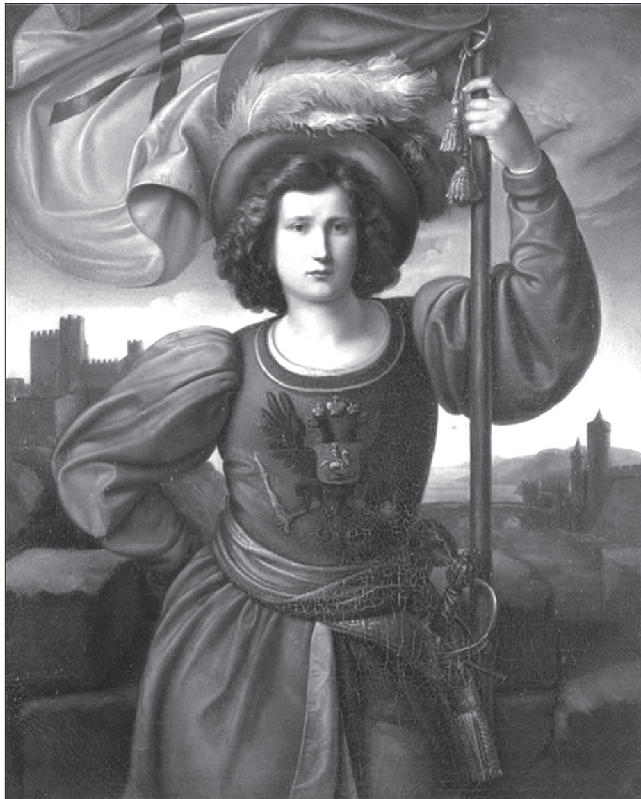
Oroszország allegóriája (Philipp Veit festménye)

nem csupán Oroszország, de talán Közép-Kelet-Európa mint geopolitikai térség is valamiképp determinált az egyszemélyi hatalomra. Emellett, mivel abban az orosz politikai gondolkodás és nyelvezet elemzésére – a címben jelzett korszakhatárokon túlterjeszkedve – olyan időbeli szemszögből kerül sor, amelynek végső vizsgálódási pontját a jelen képezi, a művet szükségszerűen fémjelzi az orosz politikai kultúra, ennek napjainkig tartó áthagyományozódása révén a politikai tradíció, mindezek folytán pedig a mentalitás főbb jellegzetességeire történő kitekintés, az eredetileg deklarált célokra túlmutató kontextus.