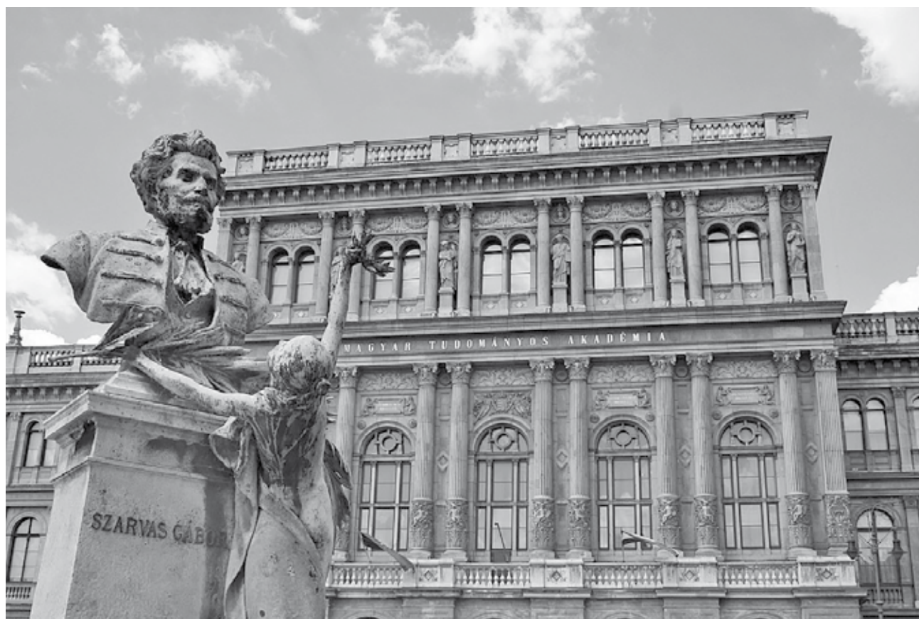
A Magyar Tudományos Akadémia épülete