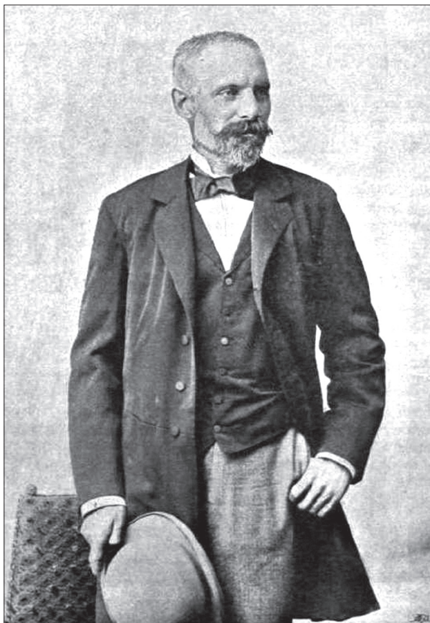
Plósz Sándor 27

Azt javasolta, hogy a kar küldjön ki újabb bizottságot az ötös bizottság „tulszigorú és tévelygő” volta miatt. 41 Kmety osztotta Grossschmid javaslatát, és kiemelte, hogy „itten valósággal erkölcsi halál osztogatattik. Már magában az is sulyos dolog, hogy egy ilyen inquisitív folyik meggyőződéseink ellen, amely megjárja a különböző hivatalokat.” 42 Szladits is hasonló kritikát fogalmazott meg: „itt embervadászat folyik és hurkokat akarnak kivetni az emberre”. 43 A kiemelt álláspontokból is látszik, hogy a bizottsági jelentés milyen felháborodást váltott ki az abban érintett tanárokból.