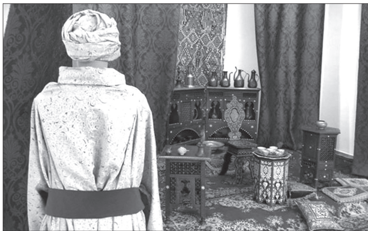
A beszélő köntös nyomában 4

E téma első feldolgozója, Schwáb Mária azt állapította meg, hogy „A török a meghódítás előtti állapotokat semmibe sem vette, hanem teljesen saját törvényei és szokásai alapján rendezkedett be”, majd más helyen pedig azt állította, hogy „a XVII. század elején a török visszaállította a városok önálló helyhatóságát”. 5 Kellő súllyal kell azonban kiemelnünk, hogy bár a török közigazgatás valóban vi-